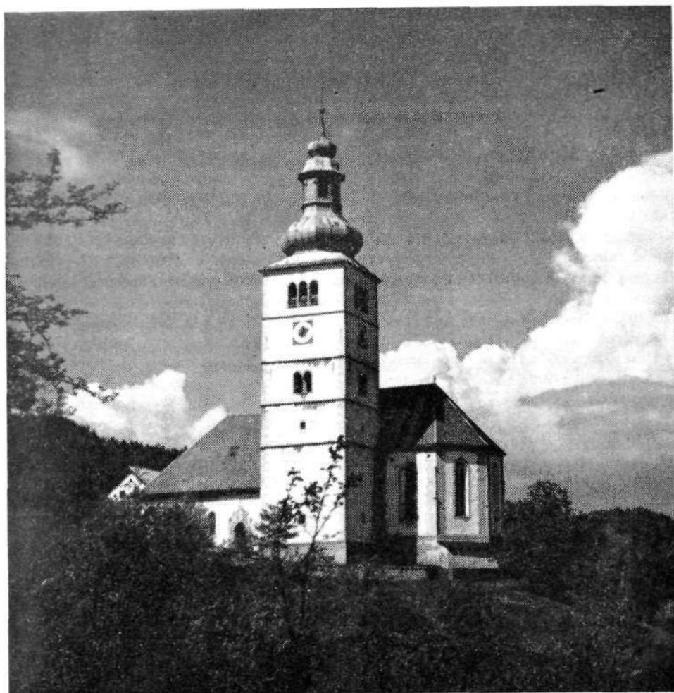
Cerkev v Crngrobu, zunanjščina.

sekove. Po stavbarniških postavah, ki so veljale tudi v naših deželah, se je moral kamnosek na primer učiti svojega poklica šest, kasneje pet let, zidarju pa so za uk zadoščala samo tri leta. Če pa se je hotel zidar povzpeti do stavbarja-kamnoseka, je moral še tri leta v uku h kamnoseku. 5 Kdor se je učil torej samo tri leta, ni smel opravljati drugih del razen zidarskih; skrivnost arhitektovega šestila in kamnosekovega dleta mu je bila še nepoznana. Zato je bil zidar na obrtniški družbeni lestvici niže ko stavbar. Kamnosek je lahko delal vse leto: pozimi je klesal kamnoseške detajle v pokriti koči na gradbišču (po tej je nastalo tudi ime »Bauhütte«!), poleti pa je zidal. Zidarjevo delo pa se je omejevalo samo na letni čas zidave; bil je samo stavbarjev pomočnik. Šele s poznogotskim časom, t. j. v drugi polovici 15. stoletja, se je tudi zidarjev družbeni položaj približal stavbarjevemu, kajti tedaj za stavbe niso več uporabljali samo klesani