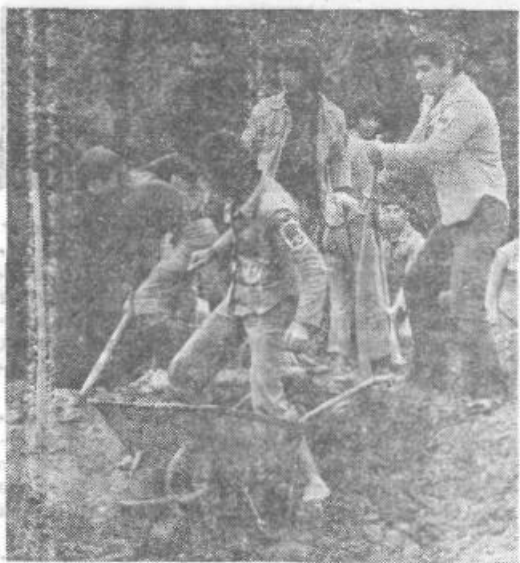
Prihodnje leto nove akcije

Povsod je bilo enako. Na trasi so pele lopate, krampi in grablje svojo pesem skupaj s pesmijo mladih brigadirjev, v naselju so ukazeljne glave požirale znanje iz marksizma, samoupravnega socializma in naše ustave, po športnih igriščih pa so odmevali vzkliki navdušenja, nekateri so z vso vestnostjo opravljali razne tečaje, po paviljonih so ropotali pisalni in razmnoževalni stroji ob tiskanju in urejevanju brigadnih biltenov, vestni fotografi in dobri risarji so ure in ure izdelovali zidne časopise, in še in še bi se dalo naštevati. Ob toplih poletnih večerih je bilo najlepše. Vsi brigadirji naselja so se zbrali skupaj na brigadnem večeru, skupaj prisluhnili veteranu ali staremu partizanu in skupaj zapeli ob tabornem ognju.