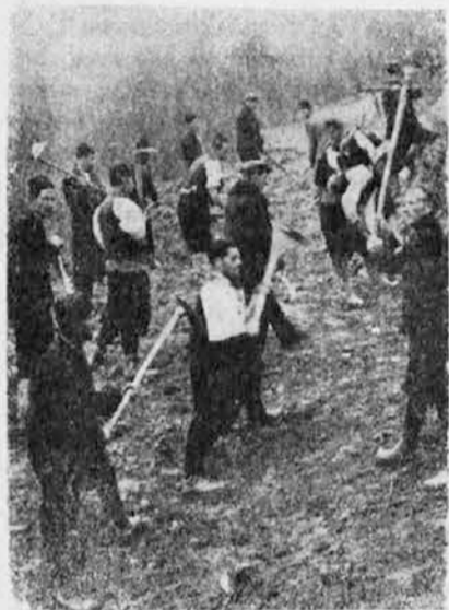
Sokolska četa Reljevo gradi seoski put (Vidi članak na str. 4.)