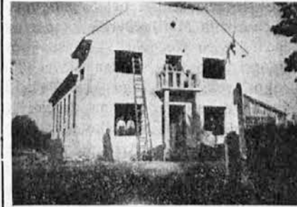
Sokolski dom u selu Srpska Trapska, kod Doboja

Marševska tragedija, donela je težak bol našem rodoljubivom na-