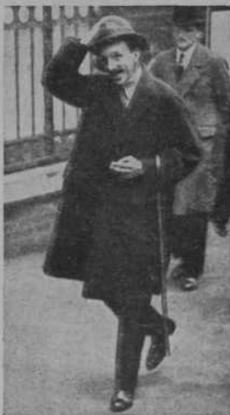
Slika levo: Španski kralj Alfonz.

Slika desno: Umetni otok sredi morja, ki ga nameravajo že v kratkem praktično preizkusiti. Namenjen je predvsem za pristanje letal, ki bodo oskrbovala potniški, trgovski in poštni promet med Evropo in Ameriko. Na otoku bo velik hotel, delavnice za popraviljanje letal in veliki hangarji.