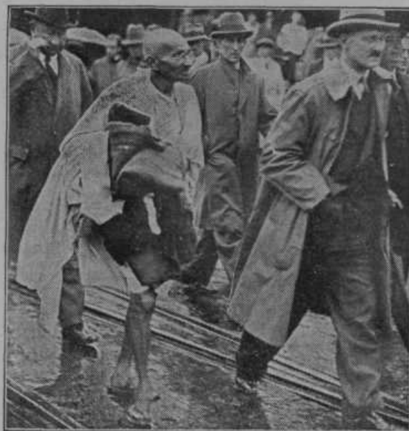
Voditelj indijskega naroda Ghandi se je udeležil posebnega posvetovanja v Londonu, na katerem se je razpravljalo o Indiji kot samostojni državi.

Katakombe, grobovi prvih kristjanov. Večno mesto Rim je še polno skrivnosti, skritih globoko pod zemljo. Italijanska država odkopuje stare spomenike in jih popravlja, sveti Oče pa smatra, da je častna zadeva katoliške cerkve, preiskati zgodovino prvih kristjanov in s tem v zvezi predvsem točno raziskati katakombe. Naša slika nam kaže katakombe, ki so jih pred kratkim odkrili in ki niso, kakor drugi podzemeljski grobovi prvih stoletij po Kr., oropane, ampak so ohranjene docela nepokvarjene.