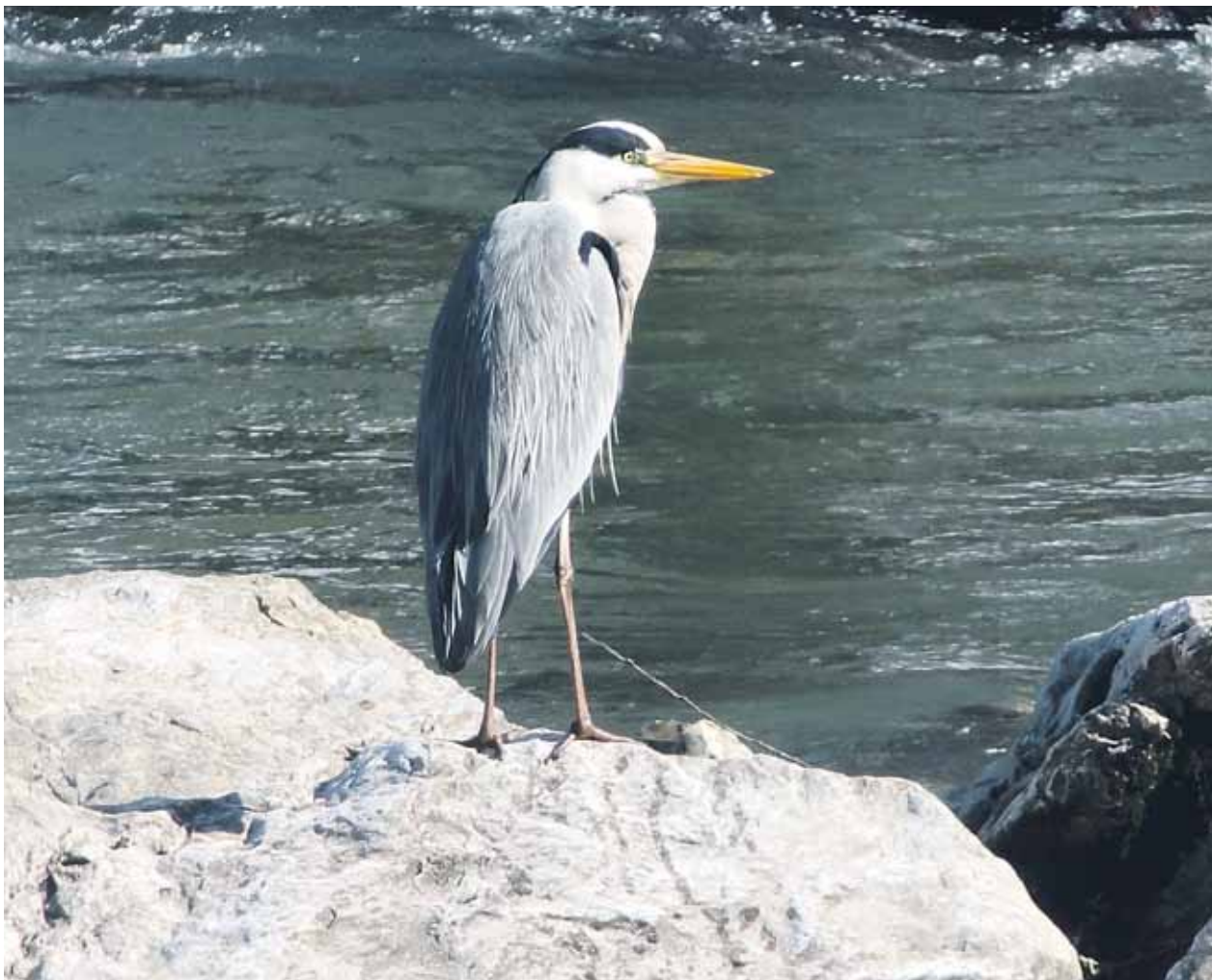
Anton Komat

Naše sive čaplje ob Kamniški Bistrici se bodo kmalu preselile na svoja gnezdišča, lahko pa pričakujemo njihovo vrnitev v pozni jeseni.