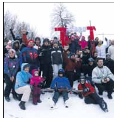
Najboljši veleslalomisti z medaljami

Zima, bela starka, je letos res snega nasula ... Lepa idila, ki pa se lahko sprevrže v manj prijetne obveznosti, ko je treba v službo in nas že navsezgodaj zjutraj čaka jutranja telovadba s kidanjem snega. Vendar, v vsaki stvari moramo poiskati kaj pozitivnega. Tako smo jih tudi člani društva ŠRD Konfin - Sv. Trojica. Konec januarja in cel februar smo vsak dan sproti postavili vlečnico in smučali na pripravljenem smučišču. V nedeljo popoldne, 17. 2. 2013, pa smo za vse ljubitelje rekreacije pripravili tekmo "Krokarjev slalom", ki se ga je udeležilo 29 tekmovalcev. Na pomoč pri urejanju proge pa nam je priskočil tudi g. Kosmatin, ki je z "ratrakom" še dodatno utrdil smučišče. Tudi v času počitnic so se lahko otroci smučali cele dneve. Zahvala vsem, ki ste s svojimi močmi prispevali k uspešni izvedbi tekmovanja in urejenosti smučišča.