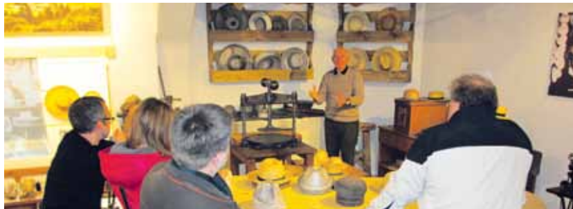
Zgodbo o slamnikih so gostje iz Avstrije, Nemčije, Italije, Madžarske in Slovenije spoznali v domžalskem Slamninarskem muzeju

V Domžalah je 11. in 12. marca 2013 potekalo srečanje partnerjev mednarodnega projekta Cultural Capital Counts (slov. Vrednotenje nesnovne kulturne dediščine), pri katerem kot partner sodeluje Razvojni center Srca Slovenije (bivši Center za razvoj Litija). Projekt je namenjen nesnovni kulturni dediščini in njenemu vključevanju v različne razvojne priložnosti, še posebej v podjetništvo.