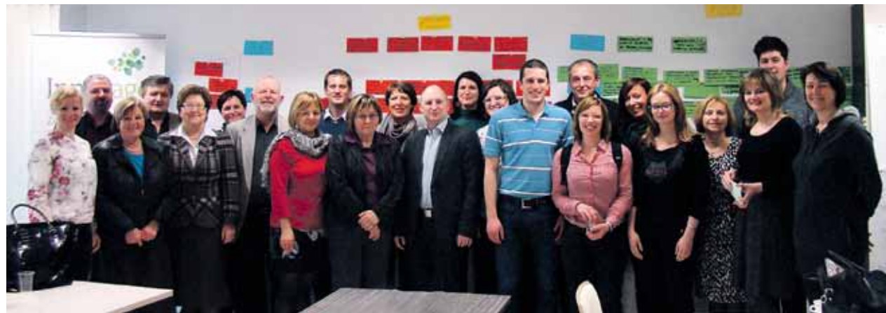
Delovno srečanje na temo aktivnega staranja in medgeneracijskega sožitja v Domžalah je bilo zelo dobro obiskano, prisotni so bili tudi predstavniki iz Domžal