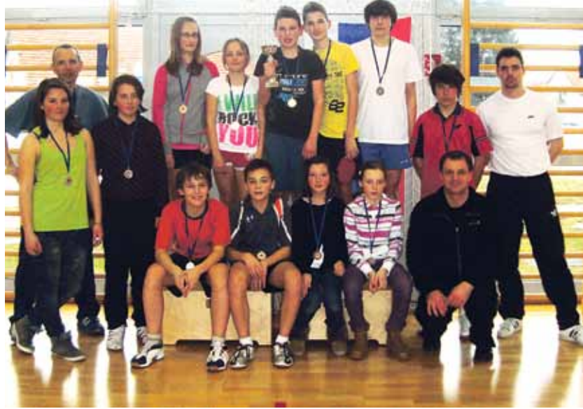
Najboljši na področnem tekmovanju v namiznem tenisu skupaj s trenerjema in organizatorjem tekmovanja