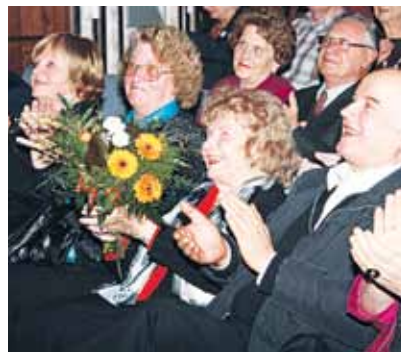
Slavnostna gostja je bila tudi operna pevka Vilma Bukovec, Gostičeva umetniška kolegica in prva dama ljubljanske Opere