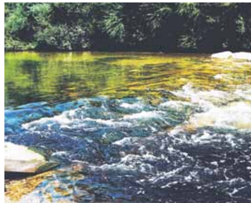
Reka Kamniška Bistrica – bivši iztok iz farm IHAN

V prejšnji številki »Slamnika« (2013; LIII, št. 2) je pri članku: Kakovost reke Kamniške Bistrice in optimizacija CCN v redakciji izpadla avtorizacija članka. To je Peter Firbas, u.d.b., Zasebni laboratorij za rastlinsko aplikativno citogenetiko Domžale