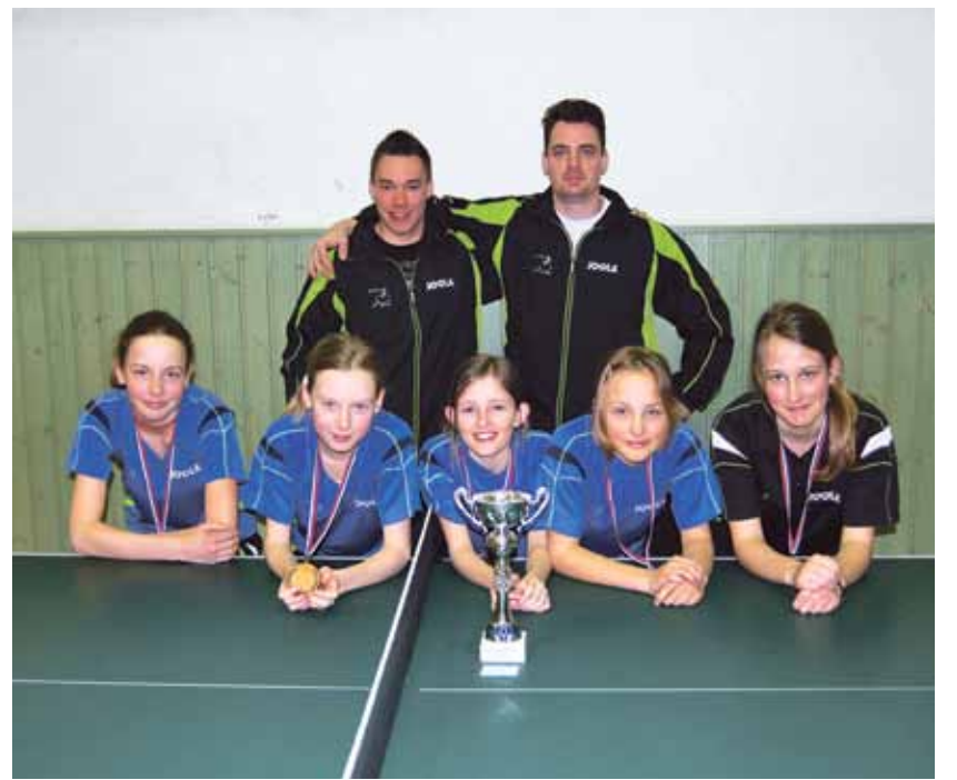
Ekipo kadetinj NTS Mengeš skupaj s trenerjema po osvojenem tretjem mestu na Državnem prvenstvu RS za kadete in kadetinjje