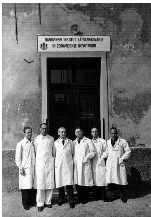
Vodstvo Banovinskega inštituta za raziskovanje in zdravljenje novotvorb pred vhodom obnovljene šempetrske kasarne, njihove prvotne lokacije, leta 1938 (SI AS 2073 Onkološki inštitut Ljubljana, šk. 2524).