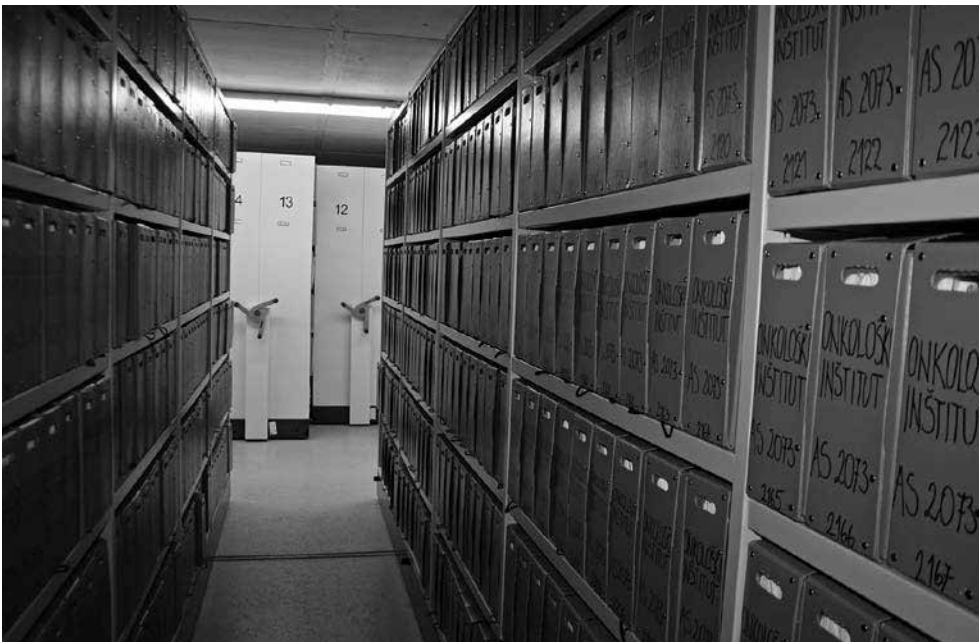
Gradivo Onkološkega inštituta v depojih Arhiva Republike Slovenije na Roški oz. Poljanski cesti (foto: Lucija Planinc 2014).

Še boljši pregled omogoča poslovanje zavoda po klasifikacijskem načrtu, saj ta z vpisanimi roki hranjenja, določenimi v skladu z obstoječimi predpisi in potrebami poslovanja, omogoča sprotno uničenje dokumentov s pretečenimi roki in odbiranje arhivskega gradiva. Mnoge, zlasti večje slovenske bolnišnice postopoma pristopajo k takemu poslovanju, 37 saj jih k temu sili vse večja količina izvorno elektronskih dokumentov. Pisno strokovno navodilo se za posamezni zdravstveni zavod v tem primeru nasloni na njegov klasifikacijski načrt. Takšna so 4 pisna strokovna navodila, ki jih je izdal Arhiv Republike Slovenije: leta 2010 Psihiatrični kliniki Ljubljana, 38 leta 2012 Univerzitetnemu klinične-