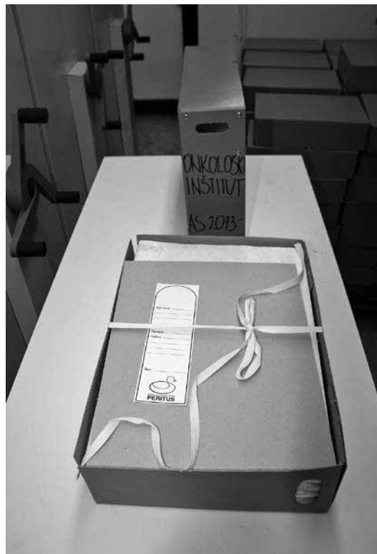
Primer urejenega gradiva Onkološkega inštituta v arhivski škatli.