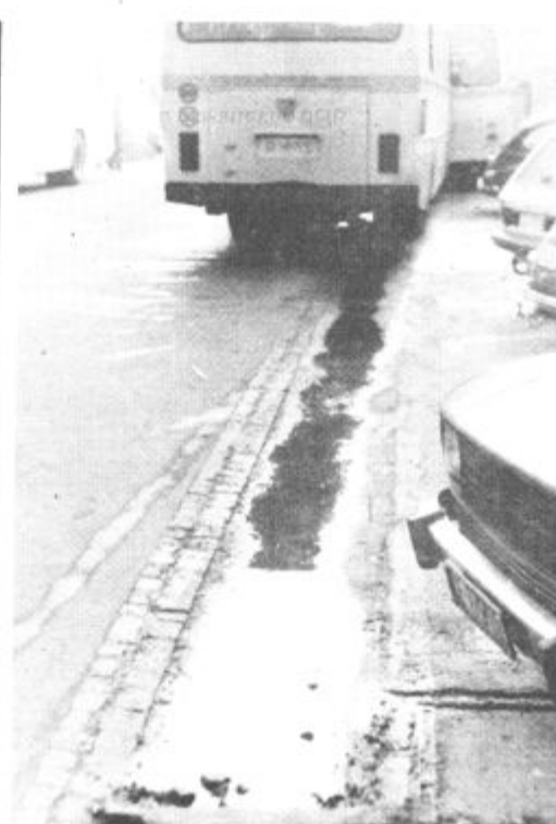
„OSVEŽITEV“ V SREDIŠČU MOZIRJA — Ni povsem jasno, kdo je upravljalca kanalizacije v starem delu Mozirja, jasno pa je, da ta kanalizacija razpada. Dokaz za to je te dni več kot očiten. Smrdljiva voda iz kanalizacije lepo teče ob cesti pred hotelom Turist, da ne govorimo o avtobusni postaji, trgovinah in ostalih lokalnih, ki jih obiskuje veliko ljudi. Vsekakor se je nekdo lepo znašel in preprečil pot smradu tudi v nasprotno smer.