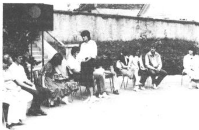
Mladi združniki dobro obvladajo ovčerejo

tamkajšnjega aktiva mladih združnikov. Z njim želijo mladi ohraniti bogato izročilo ovčarstva in iztrgati pozabi zanimiva opravila, ki so jih stroji že izrinili iz njihovega vsakdanjika. Mladi združniki so letos poskrbeli za prikaz teh zanimivih opravil, obenem pa so pripravili še tekmovanje o ovčarstvu, ki so se ga udeležili člani aktivov mladih združnikov iz vse doline. Rezultati najbrž niso najpomembnejši, bolj pomembno je, da so mladi kmetovalci pokazali