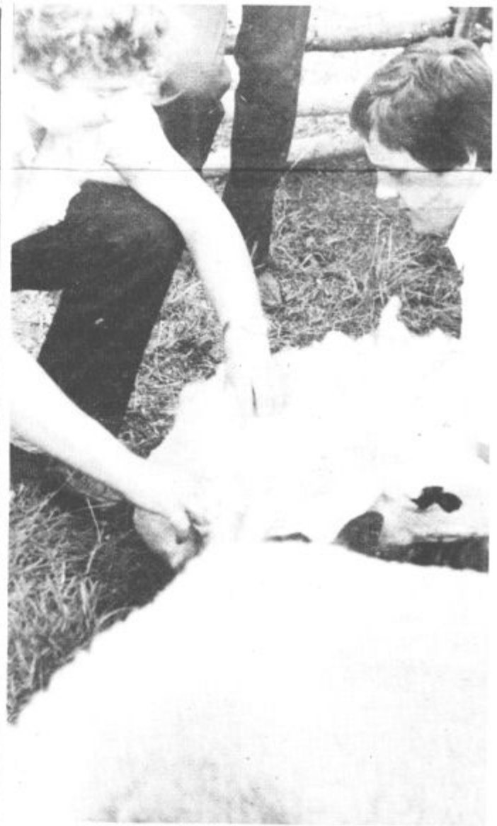
Striženje ovac je dokaj zahtevno opravilo

Seveda vse skupaj ni imelo zgolj tekmovalnega značaja. Zelo pomembno namreč je, da je vsakoletno srečanje mladih kmetovalcev lepa priložnost, da se pogovorijo o svojem vsakdanjem delu, da izmenjajo izkušnje in se seveda povese-lijajo ter sprostijo, kar si ob svojem napornem in nenehnem delu nedvomno več kot zaslužijo.