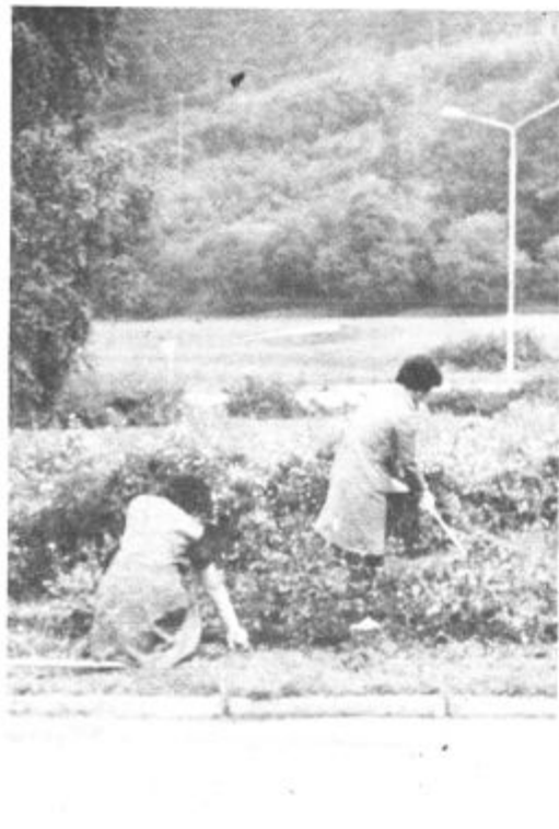
SKRB ZA LEPO OKOLJE — V temeljni organizaciji združenega dela Gorenje — Mali gospodinjstvi aparati v Nazarjah se ponašajo z velikimi dosežki na najrazličnejših področjih dela in življenja. Sem lahko štejemo tudi lepo urejeno okolico proizvodnih prostorov, ki jih urejajo delavke in delavci sami.