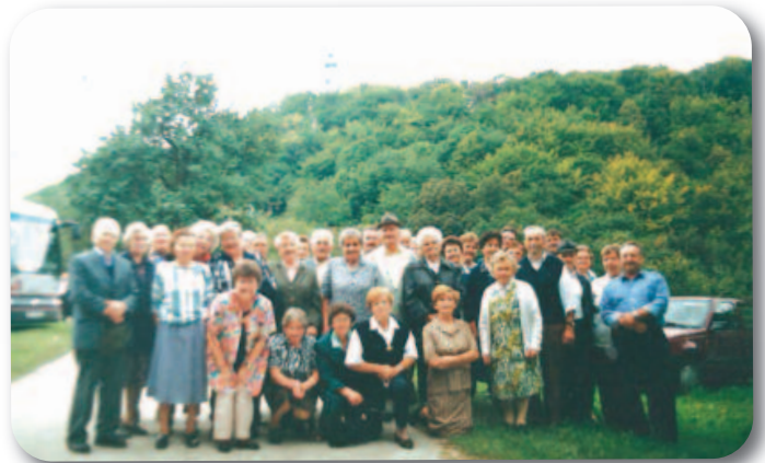
Spomin na 100. obletnico vzornega rokopisa.