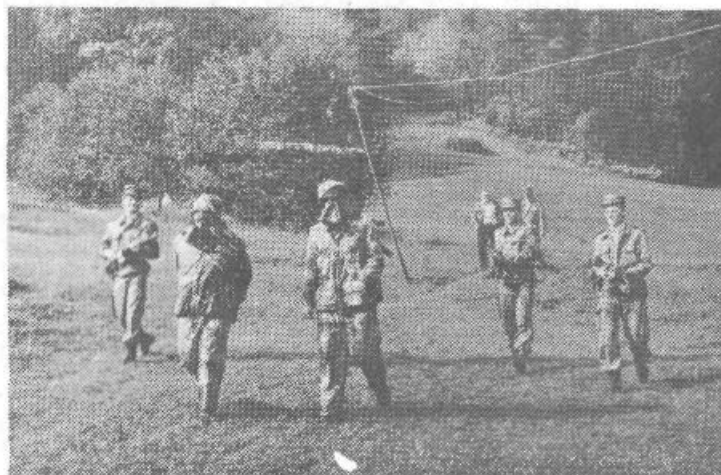
Pripadniki specialne enote milice so s pomočjo teritorialcev zajeli teroriste.