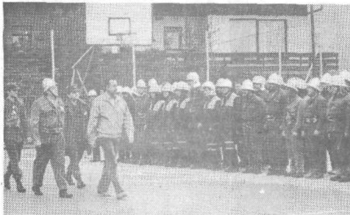
Gasilske enote in enote teritorialne obrambe je na zaključku vaje pre-