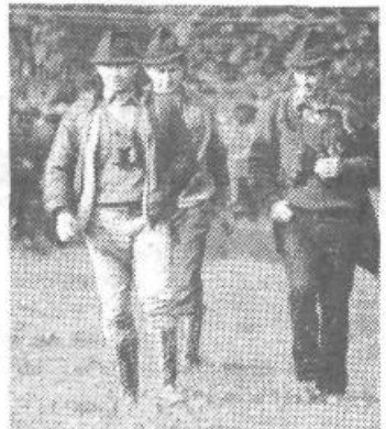
Lovci so odločilno prispevali k odkrivanju sovražne skupine.