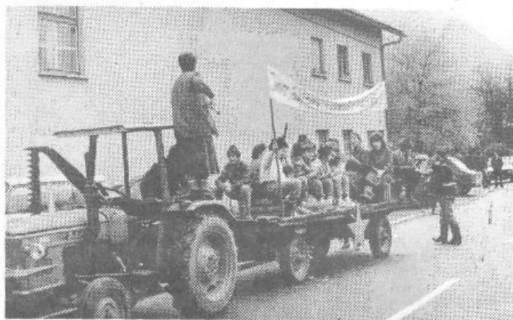
Po uspešnem koncu vaje so kulturniki pripravili še miting.