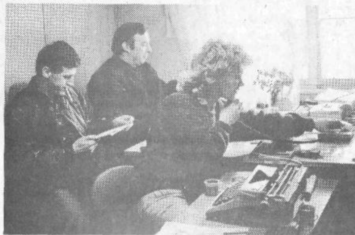
Vodstvo krajevne skupnosti je mobiliziralo vse strukture obrambe na svojem območju.