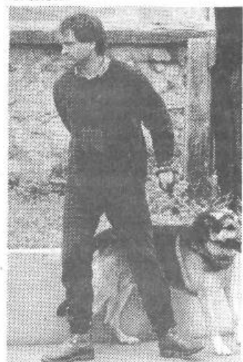
Tudi člani kinološkega društva so se vključili v odkrivanje sovražnika.