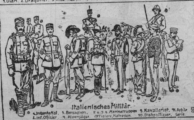
Italienisches Militär. 1. Infanterist, 2. Bersaglieri, 3. 6, 7. & Marinestruppen, 9. Kavallerist, 11. Artillerie, 2. Inf. Offizier, 4. Alpenjäger, Offiziere, Matrosen, 10. Stabsoffizier, 10. Lerie.