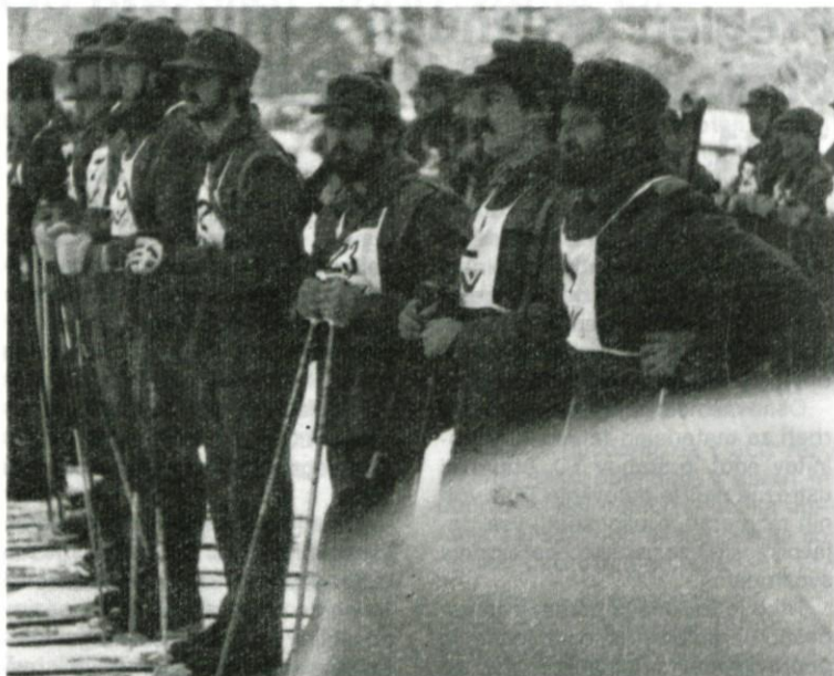
Ekipa TO Logatec na smučarskem teku TO

posebnimi nalogami v obliki seminarnarjev, tečajev ipd.