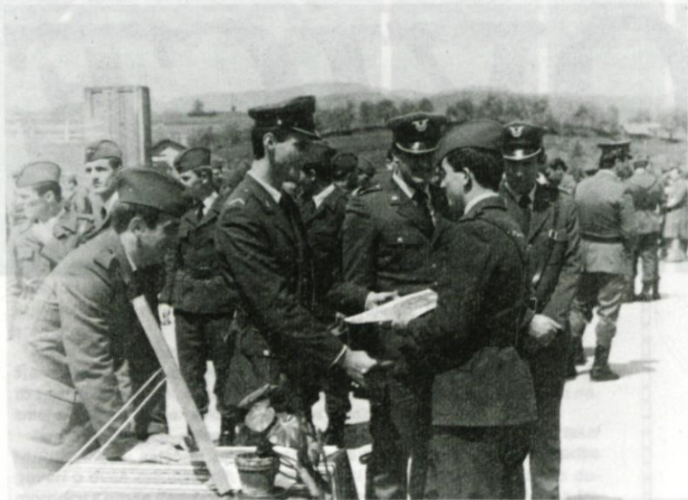
Izročanje plakete »svečana zaobljuba« mlademu vojaku

Minilo je 40 let, ko so prvi vstajniški strelci naznanili rojevanje nove socialistične družbe.