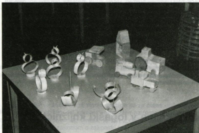
Les je vsestranska uporabna igrača

Otroci iz vrtca so ob tednu otroka za vse logaške otroke razstavili svoje izdelke, ki so jih izdelali med letom. Velika aktivnost predšolskega otroka, ki je načrtno vodena in usmerjena k določenemu cilju, rodi lahko lepe uspehe.