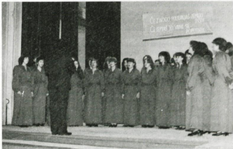
Prvi javni nastop dekliškega zbora