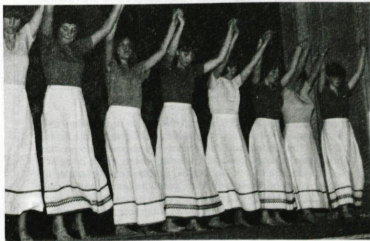
Skupina za izrazni ples je tudi sodelovala na proslavi