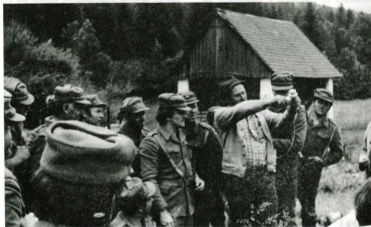
Enota med poukom

Sledeč tej Titovi misli, v skrbi za zagotavljanje naše obrambne sposobnosti, je med drugim potrebno nenehno izpopolnjevanje in urjenje enot TO.