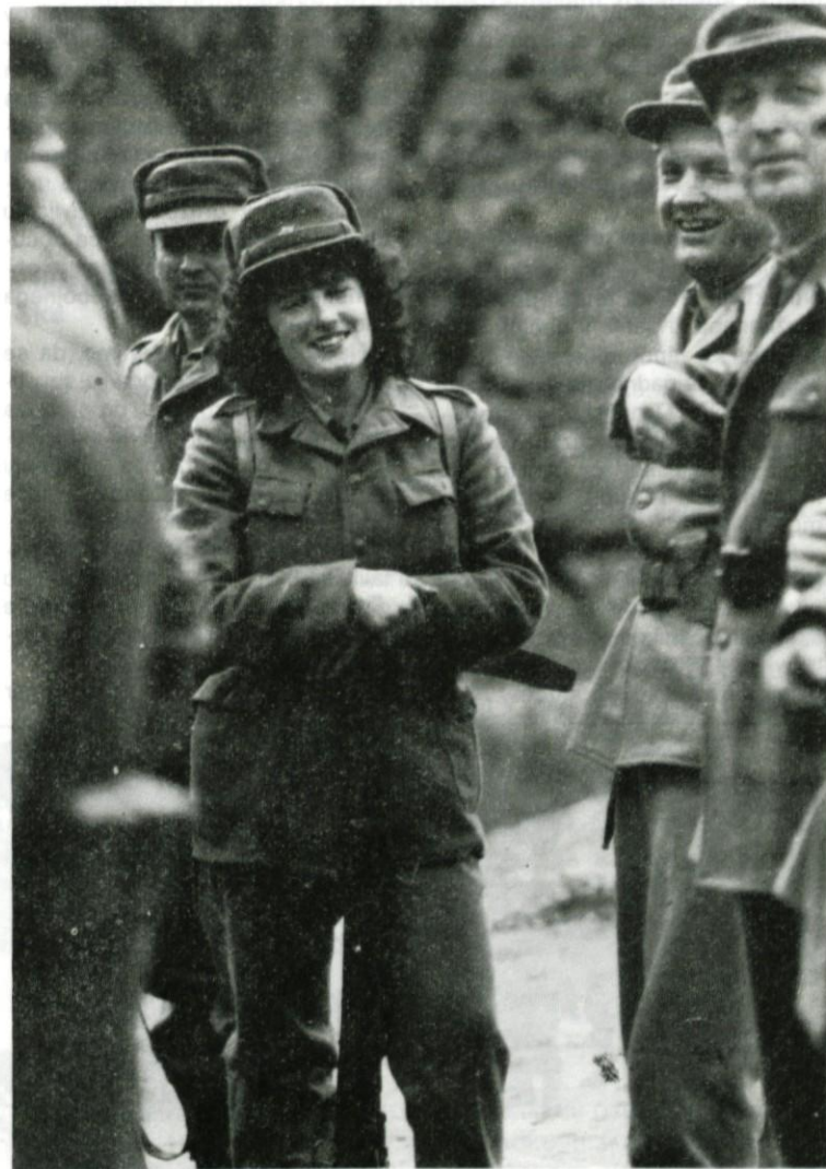
Tudi mladinke in žene v vrstah TO