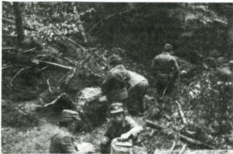
Diverzanti med pripravo za rušenje

Poleg vzgoje enot in štabov pa je skozi vse leto potekalo tudi redno usposabljanje starešin in vojakov s