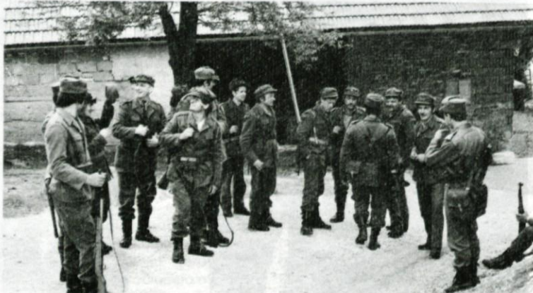
Pred odhodom na nalogo