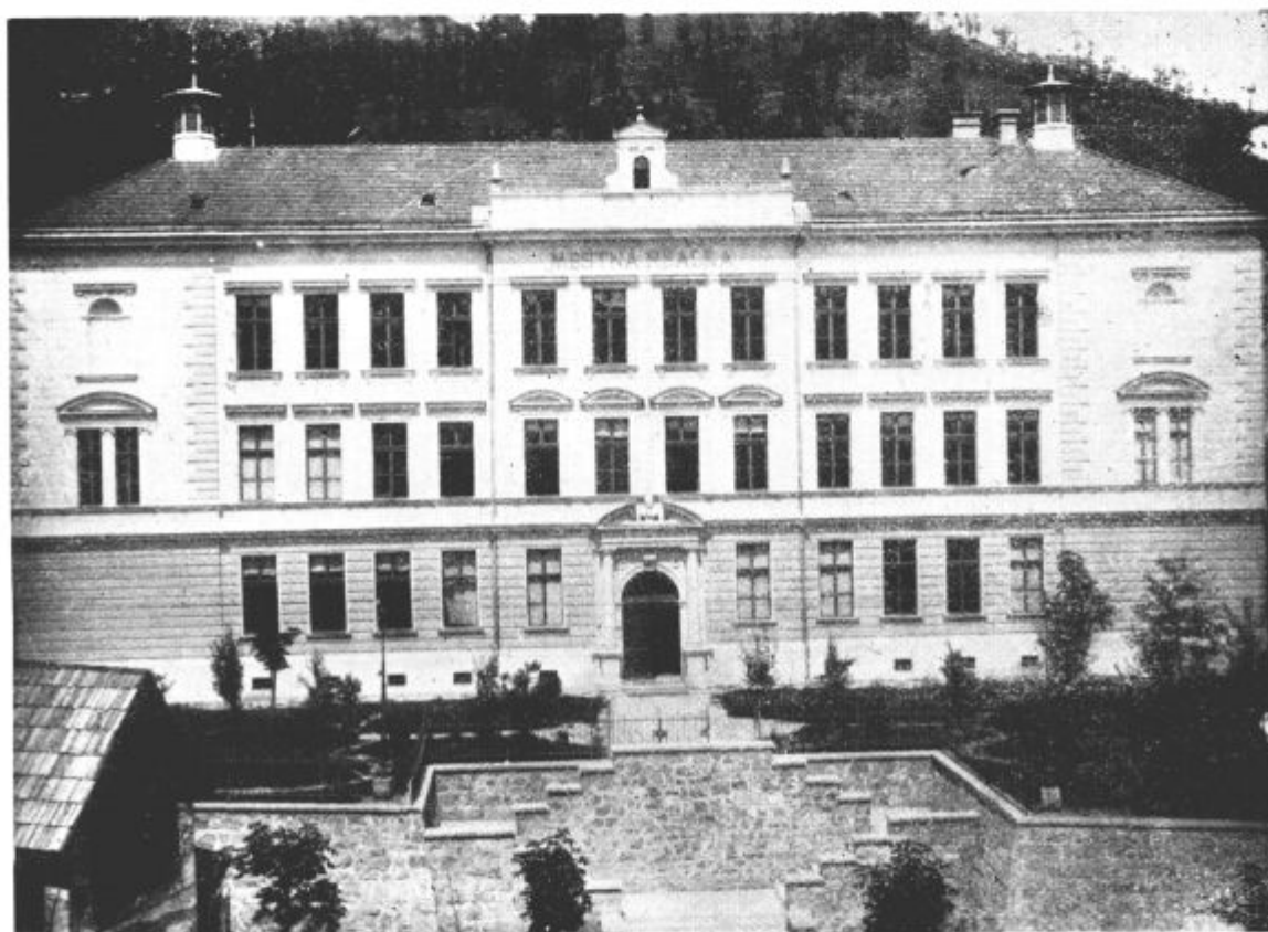
Bivša mestna realka, sedanja višja gimnazija v Idriji

Izdaja Mestni muzej v Idriji. — Uredniški odbor: Božič Lado, Jeram Janez, Gantar ing. Ivan, Murovec Stan-ko, Božič Slavica, Turk Zinka. — Odgovorni urednik Logar Srečko. — Izhaja vsake tri mesece. — Ce-loletna naročnina din 200.—, za inozemstvo din 300.— — Naslov: »Idrijski razgledi«, Idrija, poštni predal 11, telefon: Idrija 35, tek. rač. pri Narodni banki, Idrija, št. 652-T-108, telegram: Idrija muzej. Tisk tiskarne »Jadrana« v Kopru.