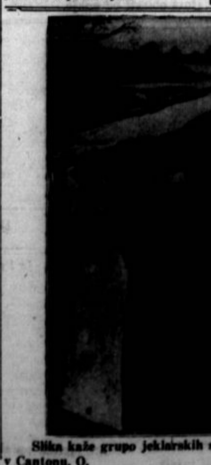
Slika kaže grupo jeklarskih stavkarjev, ki se vedno piketirajo tovarno Republic Steel Corp. v Cantona, O.