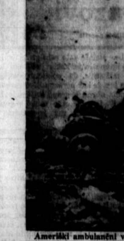
Ameriški ambulančni voz, ki so ga razbili španski fašistični letalci z bombami.

nil izjavo Franca von Pappena, bivšega nemškega poslanika na Dunaju, v kateri je slednji dejal, da si Hitler zamišlja zvezo treh držav pod kontrolo Nemčije. "Ljudstvo, ki živijo v teh državah, se ne more raznaroditi," je rekel Osusky. "Nove generacije so zrastle po svetovni vojni in te so zdaj češkoslovaške, jugoslovaške in rumunske."