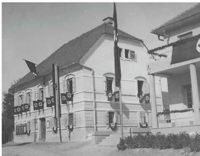
Sedež lokalnega Heimatbunda je bil v zgradbi ormoškega župnišča. Fotodokumentacija PMPO.

njegovi pripadniki pa vermani, večinoma slovenski Štajerci. 17