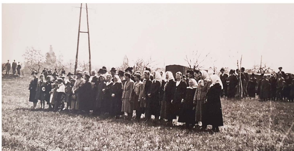
Pričakanje prihoda nemške vojske v Ormož. Fotodokumentacija PMPO.

mahala s hitlerjanskimi zastavicami in jih navdušeno pozdravljala z vzkliki »Heil Hitler!«, jih obsipavala s cvetjem in jim ponujala pijačo (»nalivala žganje«) pod velikanskimi hitlerjanskimi zastavami, ki so se vile z obcestnih kandelabrov ob današnji Ptujski cesti. Scena in