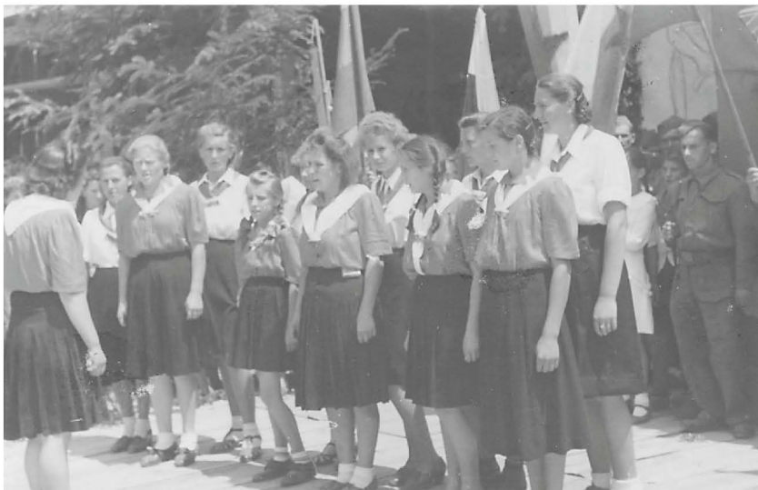
Recitatorke na prvem ormoškem mitingu v mestni grabi 13. 5. 1945.