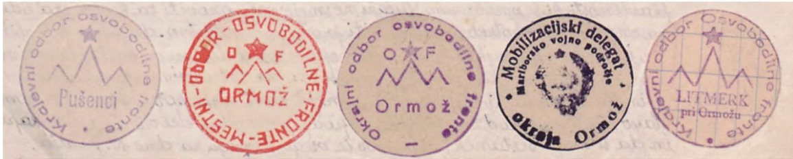
Odtisi žigov, ki so jih v Ormožu in okolici uporabljale ob koncu vojne inštitucije nove ljudske oblasti.

na Kogu delovala kurirska postaja TV-15-S, ki je povezovala ptujsko območje (TV-14) s Prekmurjem in Međimurjem (TV-15-A). 24