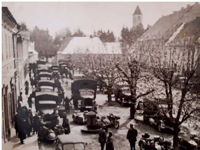
Prihod nemške vojske v Ormož 8. aprila 1941.