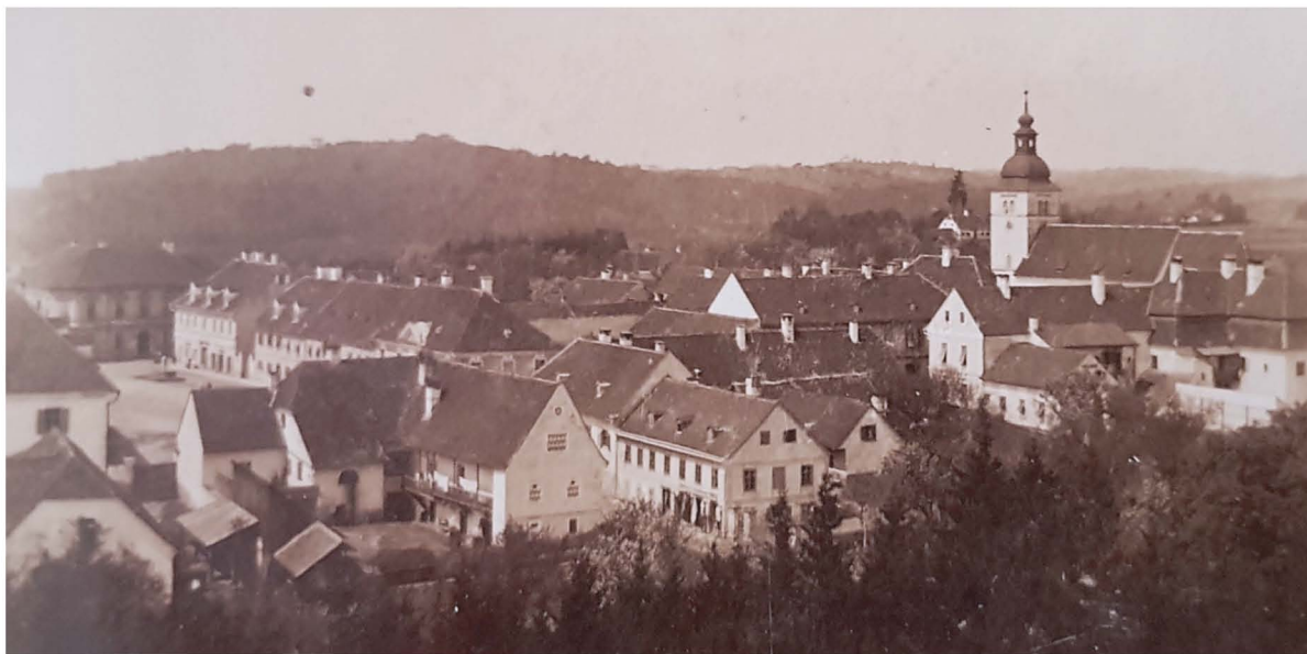
Ormož – pogled na mestno jedro z grajskega stolpa.

vsakdanje novice, ob katerih se navadni ljudje niti niso preveč vznemirjali, saj so bili preveč okupirani s skrbjo za lastno preživetje v teh težkih časih. Vojna je seveda najbolj udarila siromake in taki so prevladovali na kmečkem podeželju že v času rajnke monarhije pod Avstrijci. Za vsakokratne oblastnike so bili vedno zlasti prikladen »kanonen futer« v vojaških spopadih (veliko moških je padlo na fronti ali pa so se vrnili domov kot invalidi v fizičnem ali psihičnem smislu, saj so grozote vojne pustile na ljudeh neizbrisen pečat prestanega gorja na soški fronti in drugod) ali v mirnodobnih političnih spopadih. To nam je tudi danes dobro znano, saj se glede tega ni pravzaprav nič spremenilo v zadnjih sto letih. Čeprav je danes povprečna življenjska raven seveda višja kot takrat, pa je več kot očitno, da se povečuje razkorak med izjemno bogatimi ljudmi in ostalimi, ki živijo v upanju na boljši jutri, kar pa je zgolj iluzija navidezne dosegljivosti dobrin in ugodja, ki sta ga ustvarila kapitalizem in danes predvsem trenutno prevladujoča neoliberalna doktrina. Ne samo to, socialni prepad je vedno večji in medsebojno nerazumevanje med ljudmi tudi. Nezadovoljstvo množic se seveda odraža na različne načine, še posebej, če ga za svoje potrebe izrabljajo politične stranke.