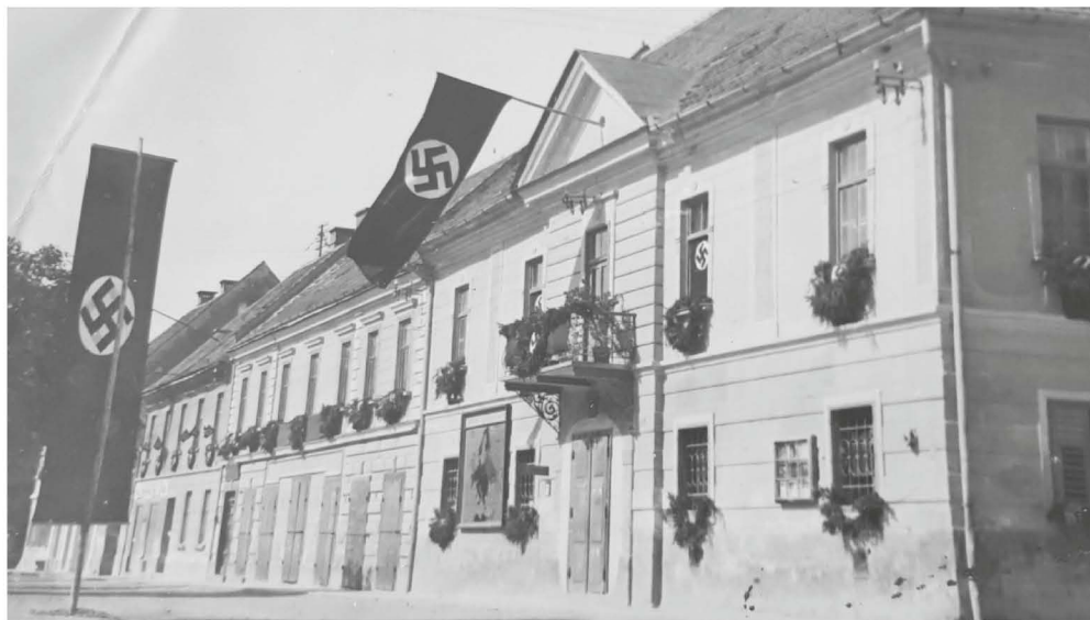
Sedež okupatorjeve občinske uprave.

okupirano in zaničevano slovensko prebivalstvo naučiti razumevanja hitlerjanskih ukazov, so pozimi 1941/2 organizirali obvezne jezikovne tečaje za odraščajočo mladino. Jeseni 1943 so odprli tudi podružnico ptujske glasbene šole, a je zanimanje od začetnih 105 pevcev kmalu splahnelo na minimum. Zanimivo, da se večkrat pojavlja številka med 100 in 120, kolikor je bilo v Ormožu leta 1941 članov kulturbunda (ti pa so znali prepevati hitlerjanske napeve že nekaj let pred tem). Morda ni popoln slučaj, da so izgnali 120 zavednih Slovencev (kot da bi moral vsak kulturbundovec kot zaveden hitlerjanec zagotoviti po eno žrtev za izgon – zavednega Slovenca!).