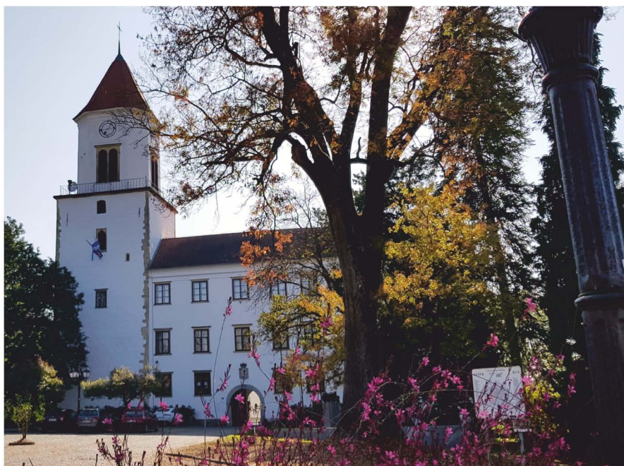
V grajskem poslopju je bilo poleti 1945 otroško zavetišče za tiste, ki so jih pripeljali iz Strnišča.