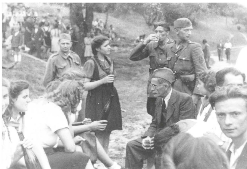
Sproščeno vzdušje na mitingu v Središču ob Dravi ni bilo nič drugačno kot v Ormožu in drugod po osvobojeni domovini.

Ta dan je namreč predsedstvo Slovenskega narodnoosvobodilnega sveta (SNOS) proglasilo za praznik zmage jugoslovanskih narodov in dokončno osvoboditev domovine od tujih osvajalcev.