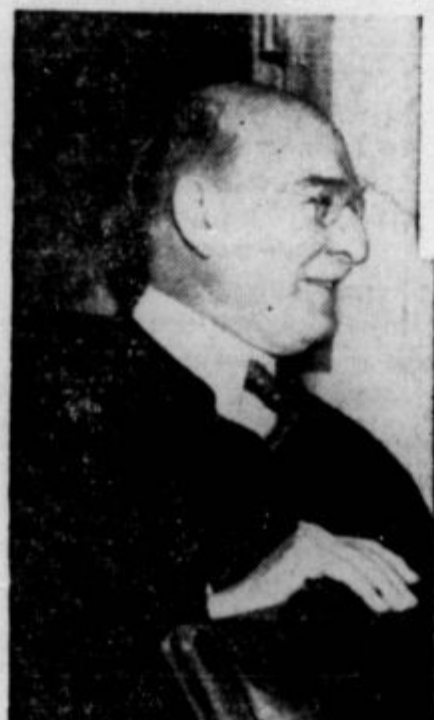
Pierre S. du Pont

Davčne oblasti že dolgo preiskujejo "čuden slučaj", v katerem se je eden najbogatejših Američanov, Pierre S du Pont, leta 1930 izognil dohodninskemu davku, in prav tako njegov tovariš John J. Raskob, ki je bil leta 1928 v kampanji