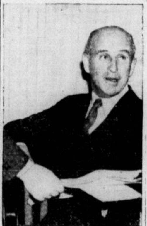
John J. Raskob

jo svojih odvetnikov dokazujeta, da ju zvezna vlada persekutira zato, ker nista "new-dealovca". Mogoče. Ampak zvezna vlada ima ogromne izdatke, in če jo bodo goljufali multimilijonarji, kakor sta Ra-