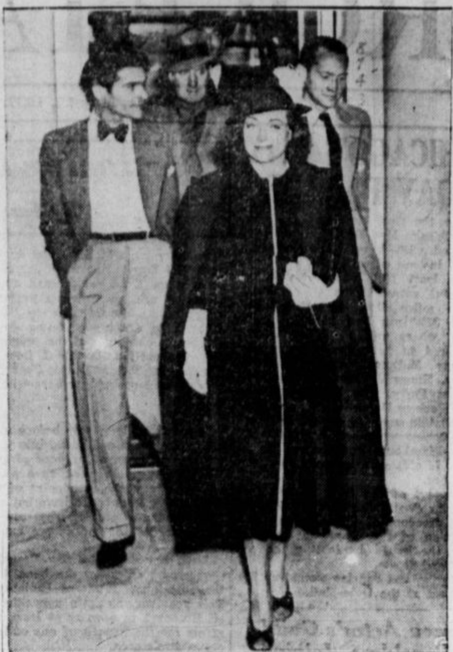
Ko je nastala v Hollywoodu stavka tehničnih delavcev filmske industrije, so prišle radi nje tudi "zvezde" v zadržku. Pred studiji so stale skupine piketov in tik njih reporterji z fotoaparati. Čemu naj bi "zvezde" sploh stavkale? Ampak delati, kadar stavkajo drugi, je tudi grdo! Pa so se posvetovali — namreč moške in ženske "zvezde" — in končno sklenili, da bodo že kako naredili, da bo prav. Stavka v Hollywoodu je ljudem, ki jo tam označujejo za "drhal", nauk, da so med igralci velike razredne razlike. Eni so "zvezde" in drugi, od katerih največ odvisi, pa "drhal".