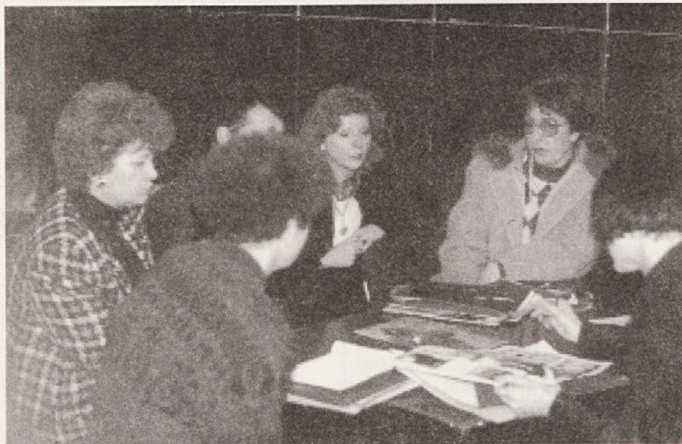
Naše kreatorke v pogovoru z novinarji