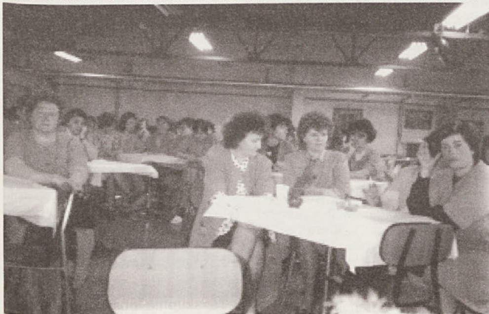
Jedilnica v Delti služi tudi za zbor delavcev in sindikalna druženja

Torej, moda je široka, svobodna in vendarle znotraj posamezne skupine, ki pa se med seboj zelo razlikujejo, tudi stroga. Mi pa ji z veseljem sledimo.