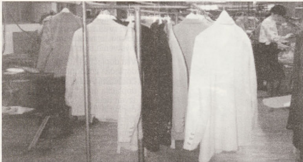
Zadnja odprema za firmo Delmod v Temenici.

V istem dnevu so bili na pogovorih v Delti kar 4 različni tuji partnerji. Direktorica je imela precej dela, da jih je uspela porazdeliti - časovno in prostorsko - tako da se niso med seboj srečali. Vendar pa z vsemi le ni mogla "do konca", tako je šla na kosilo le z enim od njih. Toda v gostilni se je srečala tudi z ostalimi... "Huda situacija", če ne bi bila tako spretna, kot je - prišla jih je pozdravit in jim zaželela vse najlepše. Gotovo so ugibali - vsak zase - kako je vedela, kje so. Med toliko gostilnami na tujskem koncu je očitno še vedno ena, ki je najboljša in katere dober glas daleč seže.