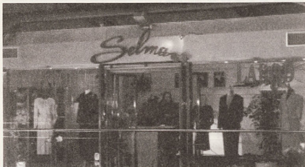
V Pragi pa je Labod tudi sicer prisoten. Naši izdelki so naprodaj v trgovini Selma, v najožjem središču Prage poleg Dior-ja, Nina Ricci itd.