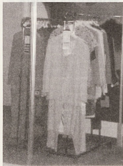
Del naše ponudbe na Češkem