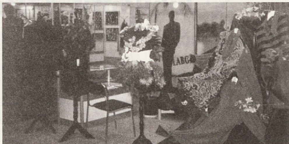
Letos se je tudi Labod udeležil sejma mode v Pragi. Tako kot večina tujih razstavljalcev je tudi Labod dobil razstavni prostor v Piramidi

Torej z dodatnimi napori bo možno doseči zastavljen cilj, toda vsi se moramo zavzemati zanj.