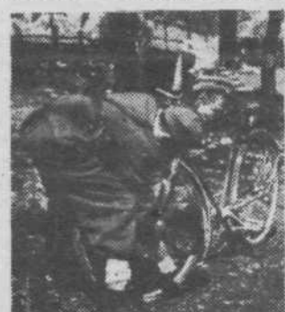
Partizanski kurir-kolesar