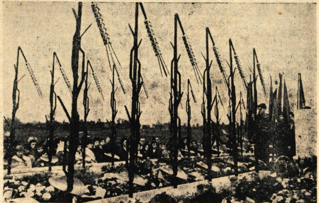
Spomenik narodnemu heroju Stanetu Žagarju, ki so ga odkrili na Srednji Dobravi nad Podnartom.

V zadnjem času opažamo, da (Nadaljevanje na 2. str.)