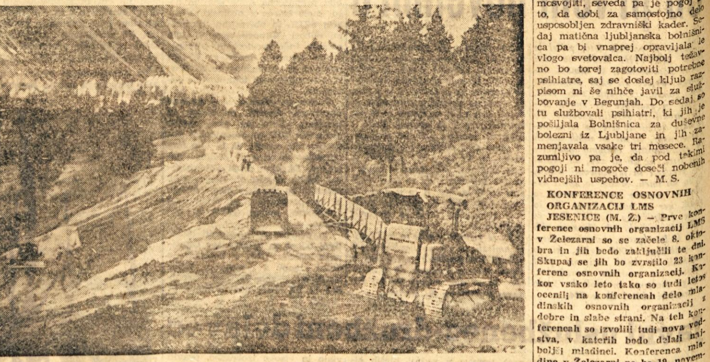
Gradnja ceste na Ljubelj.

stev je treba nameniti za strokovno izobraževanje. Delovni kolektivi odločajo sami o tem, seveda pa ne tako kot je bil v zadnjem času pogost primer, da so sredstva, ki so bila s prejšnjimi uredbami za to zagotovljena, razdelili med osebne dohodke.