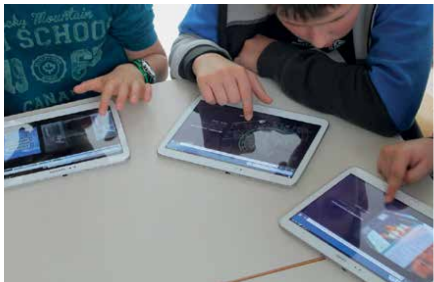
Slika 1: Osebnosti skrbno varujemo v katerikoli klepetalnici, saj internet ni otroško igrišče!