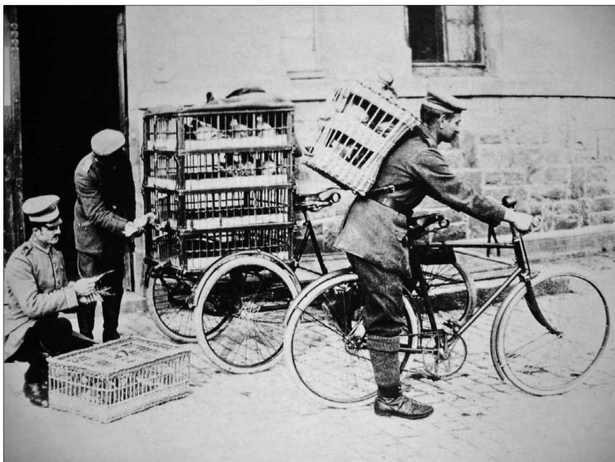
Transport francoskih golobov s kolesom, zahodna fronta 1918 (Buccioli, Animali al fronte , str. 72).

streljevanja. 60 Zelo uporabni so bili pri topniškem izvidovanju, ko so lahko izvidniki hitreje poročali topništvu o položaju sovražnikovih enot. Bili so redni sopotniki tankovskih in letalskih posadk. Tankovske posadke so z njimi sporočale svoje položaje, piloti pa so jih uporabljali za klice v sili. Neki britanski oficir, ki je poveljeval prvemu bataljonu tankovskega korpusa, je trdil, da so golobi pogosto reševali bojne situacije in jih niso zmotili niti plin ali topništvo. Bitka pri Monchy le Preuxu, v okviru bitke za Arras pomladi leta 1917, naj bi bila rešena zaradi golobjega sporočila enotam za napredujočimi tanki. 61 Neko angleško letalo je med patroliranjem nad Severnim morjem zasilno pristalo v morju. Posadki je uspelo odposlati goloba kot klic v sili, ki je v 22 minutah preletel 35 kilometrov in jih s tem rešil gotove smrti. 62 Golobe so uporabili v obveščevalne, a tudi v protiobveščevalne namene.