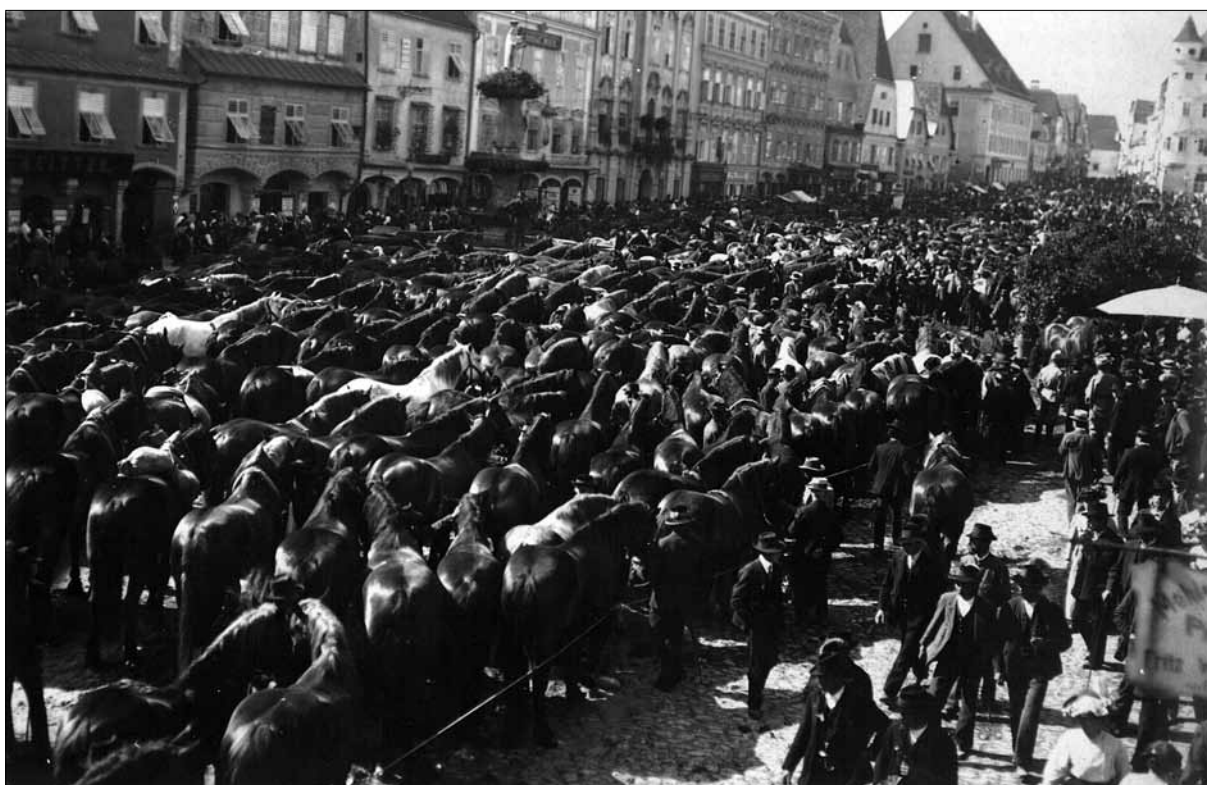
Mobilizacija avstroogrskih konj v Ennsu, julija/avgusta 1914.

bljejo med 5,6 milijona 7 pa vse tja do 8 milijonov. 8 Aleksander Lavrenčič je z upoštevanjem slednje številke napravil zanimiv izračun, ko pravi, da je: »... zemlja na vseh bojiščih nosila okoli 5,6 milijona ton teže v vojaških škornjih in okoli 4,8 milijona ton teže na kopitih, pokopala pa je približno 800 tisoč ton človeškega mesa in kosti ter približno 3.360.000 ton konj, ki so tiho stopali v največjo klavnico, kar jih je svet doslej videl.« 9