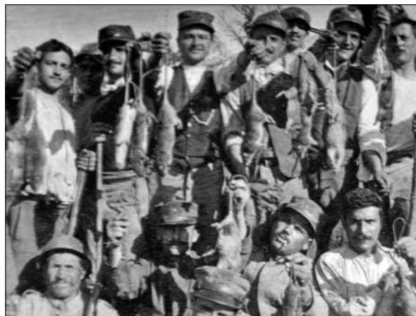
Vojaki postavijo na ogled svoj »ulov« (Buccioli, Animali al fronte , str. 50).

love jih v pasti, zažigajo in zastrupljajo jih, kjer in kakor kdo more. Ali vse dosedanje pokončavanje ni imelo dovoljnega uspeha. Namesto ene, ki je poginila, je deset, dvajset drugih, ki so ušle smrti. Njih največji sovražnik so doslej še psi. Francoska vojna uprava je naročila 1200 psov - podganarjev, ki jih odpošljejo kar najhitreje na fronto. Izborno so se proti podganji preglavici obnesle sovražne bombe z otrovnim plinom. Francoski častnik pripoveduje, kako je moral začasno zapustiti strelski jarek s svojim moštvom, a ko se je vrnil nazaj, je našel sto in sto mrtvih podgan. Poslednji čas pa je posegel v to vojsko dobro poznani Pasteurjev zavod. Iznašel je posebni serum, ki se je neki izborno obnesel. 1200 litrov se ga odpošlje na fronto vsak dan.« 68 Eno zanimivejših rešitev najdemo v svetu mode, saj je francoski list Gaulois Parižankam predlagal, »... naj v znak patriotizma uvedejo podganjo kožuhovino v modi; na ta način se bo prihranilo dokaj narodnega premoženja, ki bo šlo drugače za drago kožuhovino, na drugi strani pa bodo imeli francoski vojaki postranski dohodek iz lova na podgane. Bomo videli, kaj bo.« 69