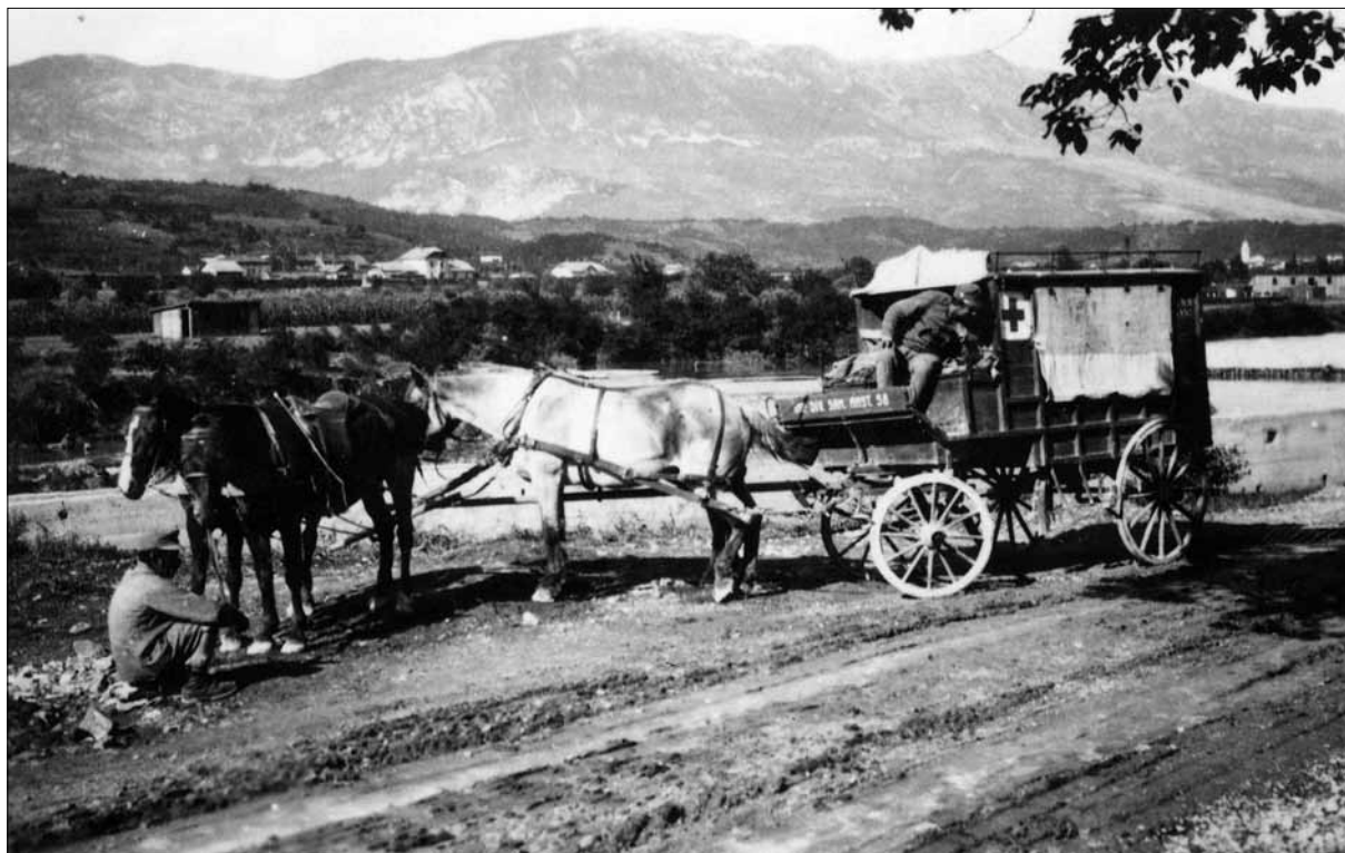
Avstroogrski sanitetni voz Rdečega križa v zaledju soške fronte (Muzej novejšje zgodovine v Ljubljani).

V transportne namene so uporabljali od majhnih bosanskih brdskih konj do najtežjih belgijskih, renskih in angleških ras ter poskočnih arabskih mešancev. Tovorili in prenašali so na vseh bojiščih prve svetovne vojne, od zahodne do vzhodne fronte, v Italiji, Afriki in na Bližnjem vzhodu, predvsem pa tam, kjer je bil motorni transport neuporaben ali pa ga sploh ni bilo. Na naših tleh si na primer brez transportnih konj ni bilo moč zamisliti učinkovitega oskrbovalnega sistema bohinjskega zaledja, ki je oskrboval fronto v zgornjem Posočju, predvsem odsek od Bohinjske Bistrice do Ukanca in Zlatoroga in naprej. Sprva so se tu valile kolone transportnih voz, kasneje pa je bila zgrajena ozkotirna konjska železnica. 29