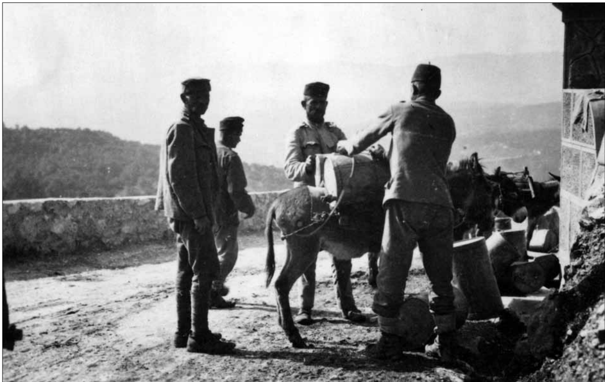
Natovarjanje osliča s sodi z vodo (Muzej novejšje zgodovine v Ljubljani).