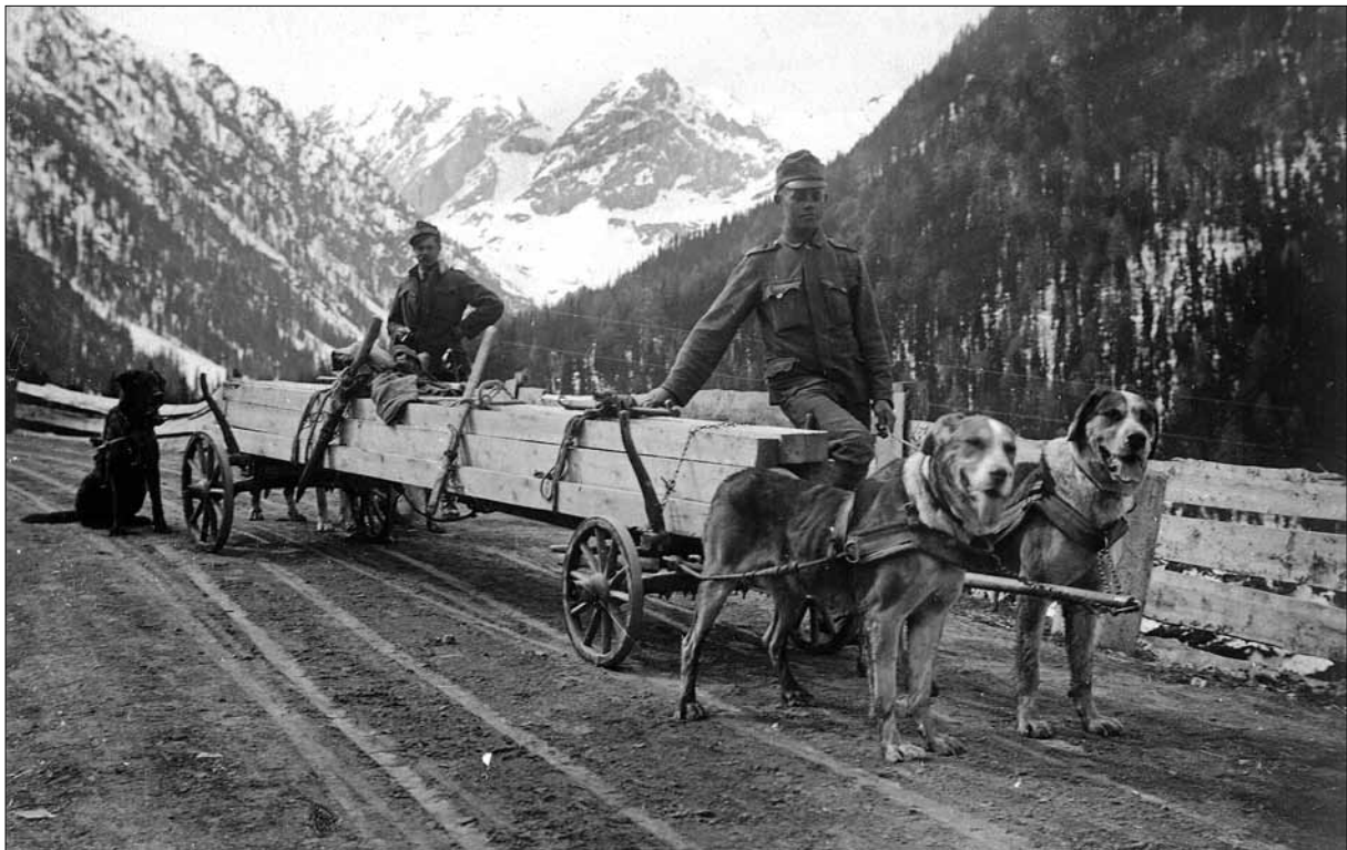
Avstroogrski vlečni psi na tirolski fronti (zasebna zbirka Walterja Lukana).

tetnih psov je težko oceniti. 42 Po podatkih vojaške enciklopedije so nemški sanitetni psi rešili okoli 20.000, francoski pa 8.000 ranjencev. 43