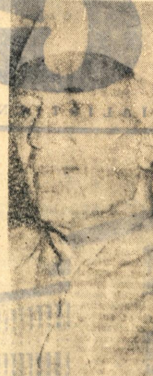
Indijski premier Nehru, zaskrbljen in odločen, ker Indija kitajskih vpadov na indijsko ozemlje ne more več prenašati.

gradili so stopnice, da bi se povzpeli na „streho sveta“. Ze v oktobru mesecu je indijska vlada prvič po diplomatski poti negovala zaradi izgradnje vprečnih stez v pokrajini Ladak, severovzhodno od Kašmira.