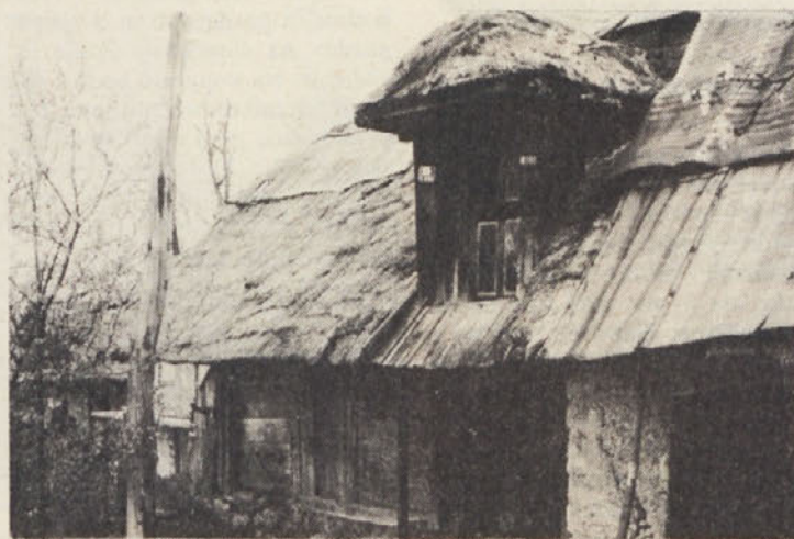
Zanimiva arhitektura stare kmečke hiše v Podturnu pri Hmeljniku.

Za preprečevanje škod v gozdovih zaradi onesnaženega zraka potrebujemo gozdarji pomoč širše družbene skupnosti, saj so vzroki za umiranje gozdov v glavnem izven našega neposrednega vpliva. Zato od družbenopolitičnih skupnosti v našem območju pričakujemo, da bodo načrtovale tak razvoj, ki ne bo vplival na povečanje onesnaževanja zraka, da bodo pripravile programe zmanjševanja onesnaženosti zraka v skladu s sklepi skupščine SR Slovenije, da bodo pripravile katalist onesnaževalcev zraka v območju in zagotovile redno spremljanje onesnaženosti in da bodo zagotovile poostren nadzor izva-