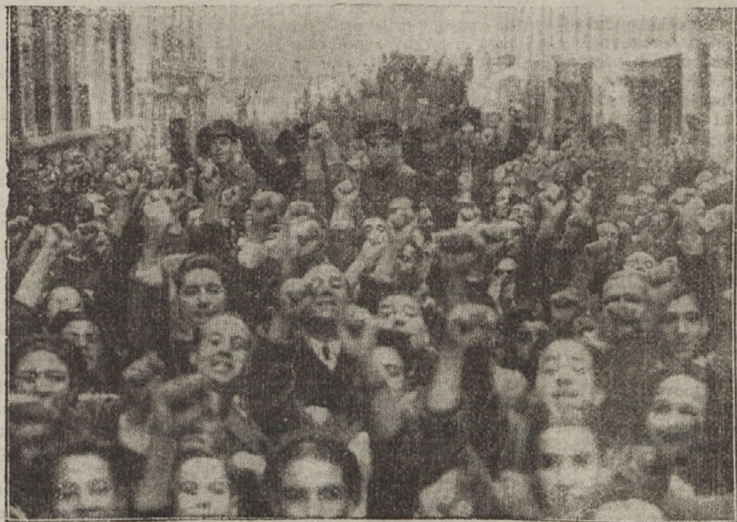
Slika kaže množico levičarskih demonstrantov v Madridu. Med njimi so tudi policijski uradniki in stražniki, ki so se levičarjem pridružili. Vladne čete so jih kmalu nato napadle. Bil je več mrtvih in hudo ranjenih

— Sijajno! Novakulja se je ločila, Suhadolnica ima novega hišnega prijatelja, Turkova se mož, Kunca so pa zaprli.