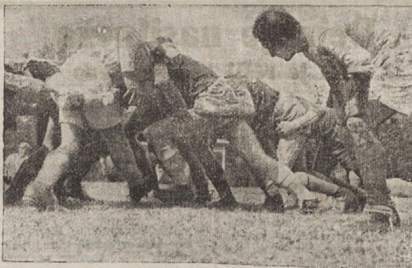
Slika kaže nemške dijake, ki trenirajo rugby. Sportniki vedo, da zahteva ta igra dokaj poguma. Nemci jo zadnje čase zelo goje, ker pravijo, da vzgaja z večjim uspehom kakor nogobrc mladeniče v može

— Gospod, nisem ga mogel pokopati. Glejte tu v omari je trupelce. Toda nikar ne mislite, da sem izvršil zločin.