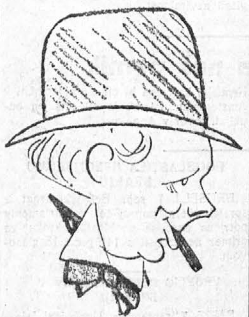
WINSTON CHURCHILL, minister mornarice.

GIBRALTAR, 7. septembra. V tukajšnjem pristanišču je zbranih 133 angleških in francoskih bojnih ladij. Mesto je polno vojaštva in mornarjev. O namenih te koncentracije brodovja in vojske ni mogoče ničesar izvedeti.