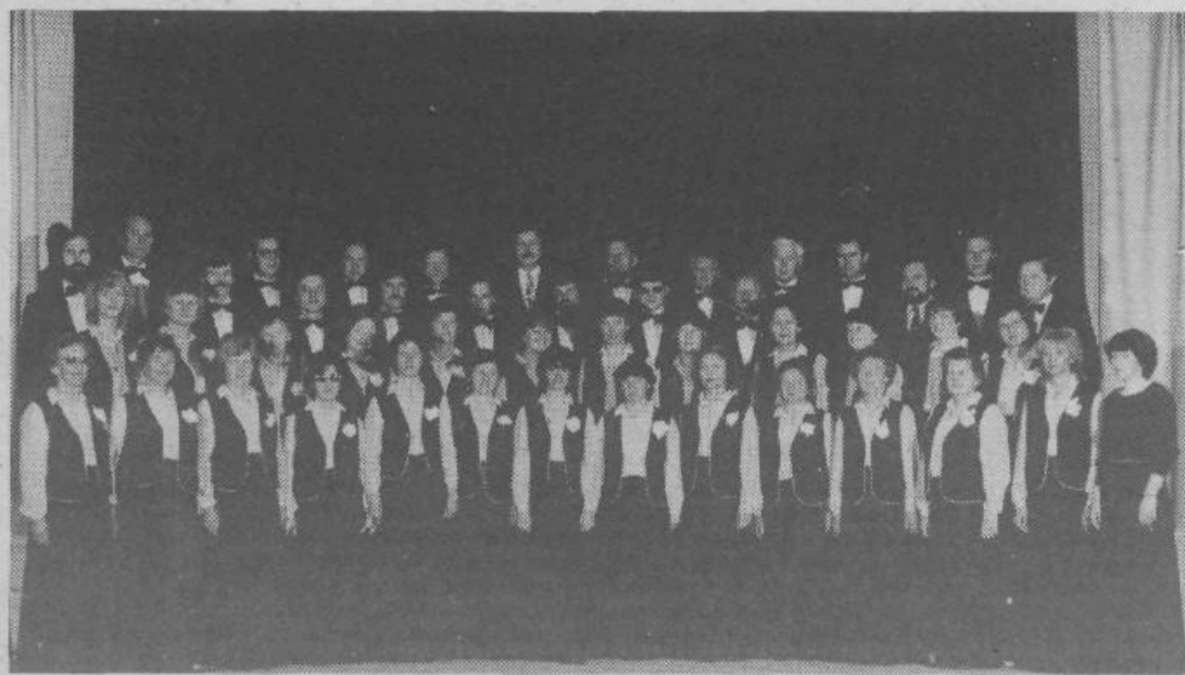
Mešani pevski zbor Vevče v polni sestavi med nastopom