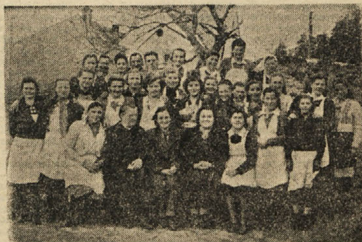
Gospodinjki tečaj na Dolah pri Litiji je bil uspešno zaključen.