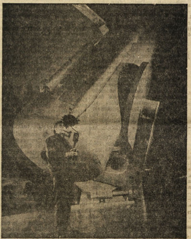
Ameriški astronom dr. Edwin P. Hubble opazuje vsemirje z največjim teleskopom sveta, ki je bil izdelan v Kalliforniji v inštitutu Mount Palomar.

Ta teleskop velja kot največji na svetu, ki je bil kdaj izdelan v tem tehnološkem inštitutu.