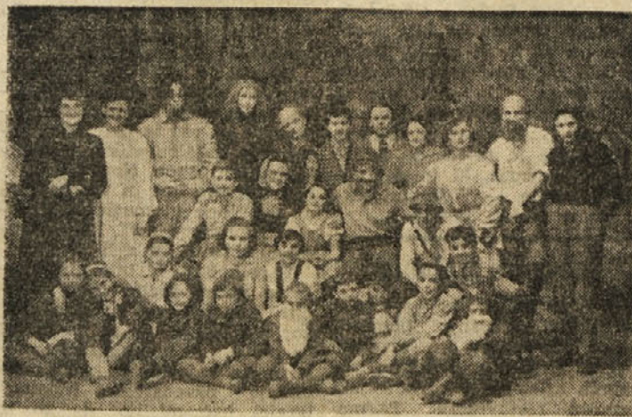
Prizor iz mladinske igre »Teta Pehta«

V Trbovljah delujeta dve dramski skupini. Pripravili sta nam že nekaj uspešnih prireditev, ki so bile pretežno namenjene odraslim. Kako hvaležni gledalci so pa ravno otroci in s kakšnim zanimanjem sledijo predstav, se je pokazalo že