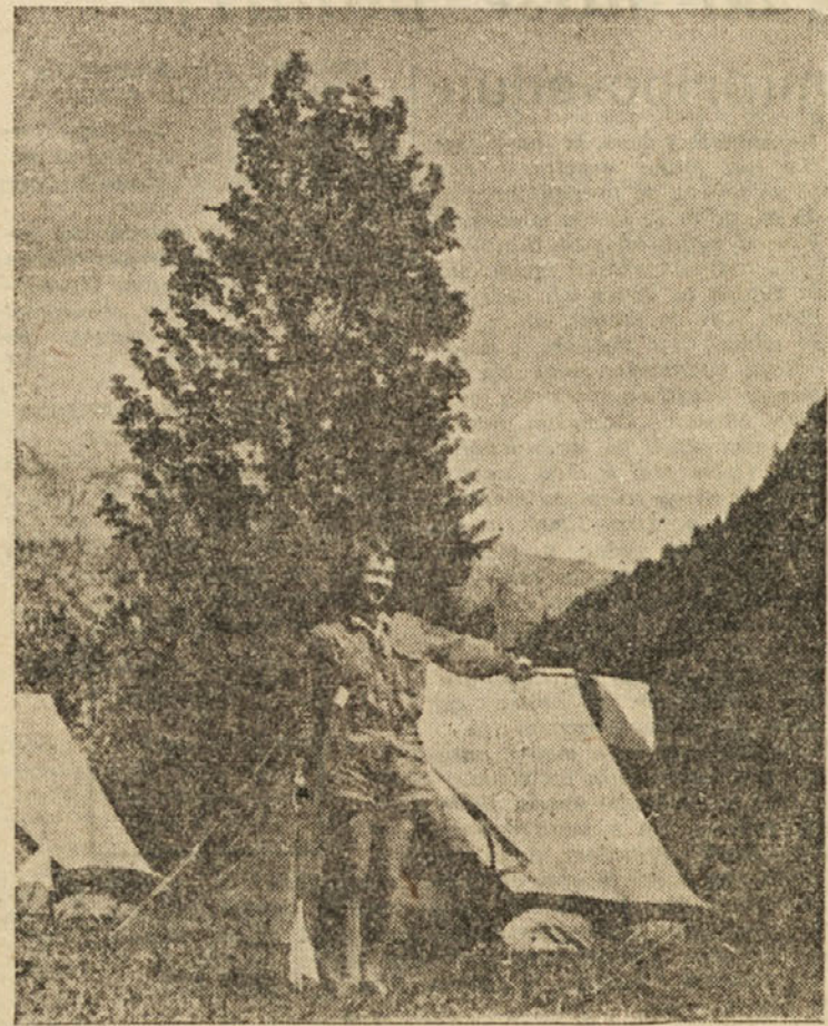
Taborniki pozivajo na zbor.

Ob tej priložnosti je še potrebno omeniti, da »Rudar« ne bi imel tistega uspeha, kot bi ga lahko in bi ga moral imeti, kar pa odvisi od resnosti samih igralcev, ki so v sestavi I moštva. Zato naj prizadeti igralci ne čakajo lepih in toplih dni z raznimi izgovori, tudi naj ne mislijo ob odigranju tekme zgolj na zabavo — pred očmi naj jim bo, da je prvenstvo in prva važna tekma pred vrati.