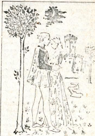
Prihodnja premiera v PG bo »Trnuljčica«