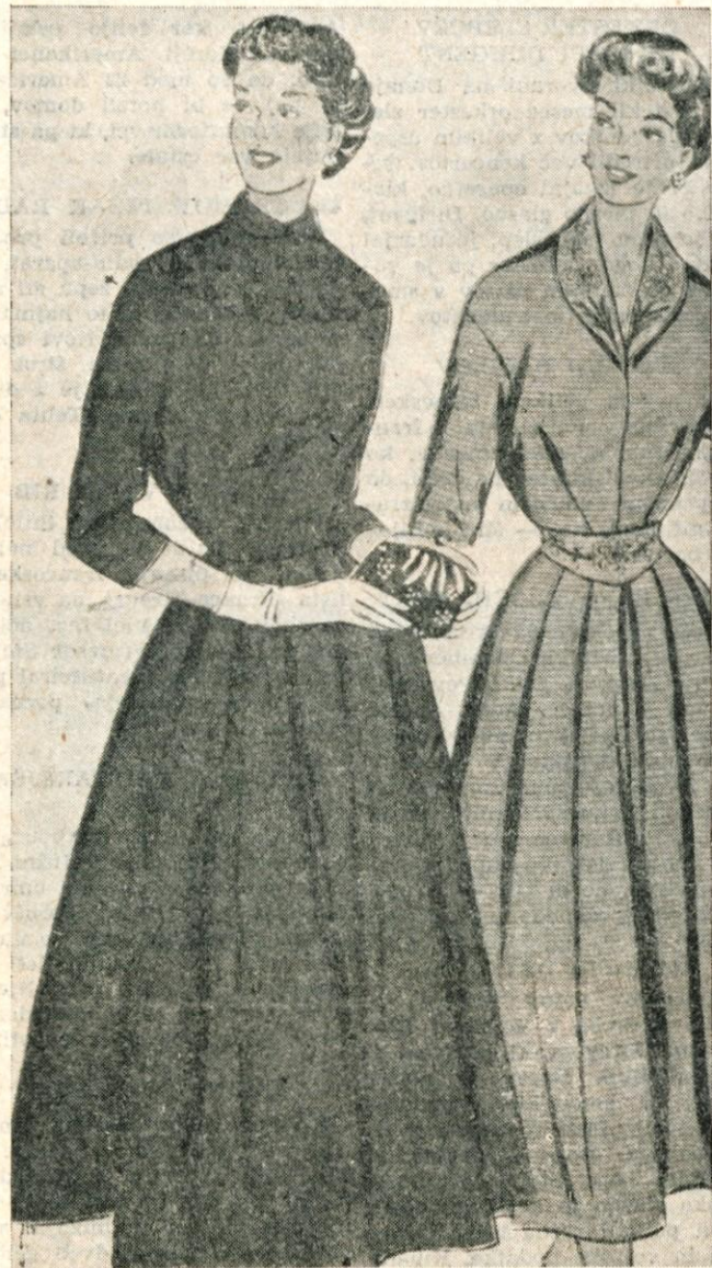
1. Rdeča popoldanska obleka s črnim žametnim okrasom. 2. Zlato vezenje na ovratniku in pasu da preprosti zeleni obleki eleganco