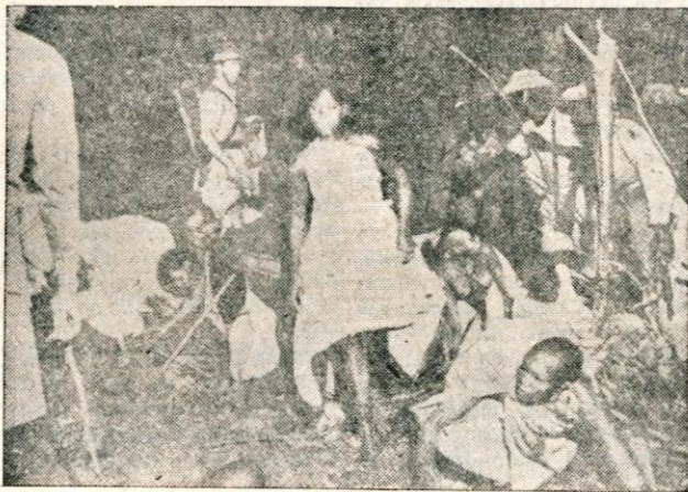
Celo obredni plesi so pod britansko stražo

in uporaba strupov. Kikujji mislijo, da je tako čaranje v nasprotju z moralnimi zakoni, toda kljub temu je pri njih znana priprava strupa »orogo«. To je pravi strup. Pridobivajo ga čarovniki iz strupenih zelišč. Kako, — to je tajnost. Kadar so pri tem opravili, ne sme nihče nositi obleke ali stopiti v prostore, kjer se to dogaja.