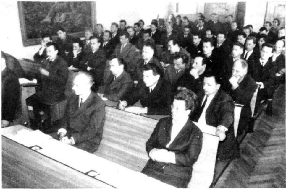
Sedanja skupščina občine Skofja Loka

— sprejema resolucije in daje priporočila organom družbenega samoupravljanja.