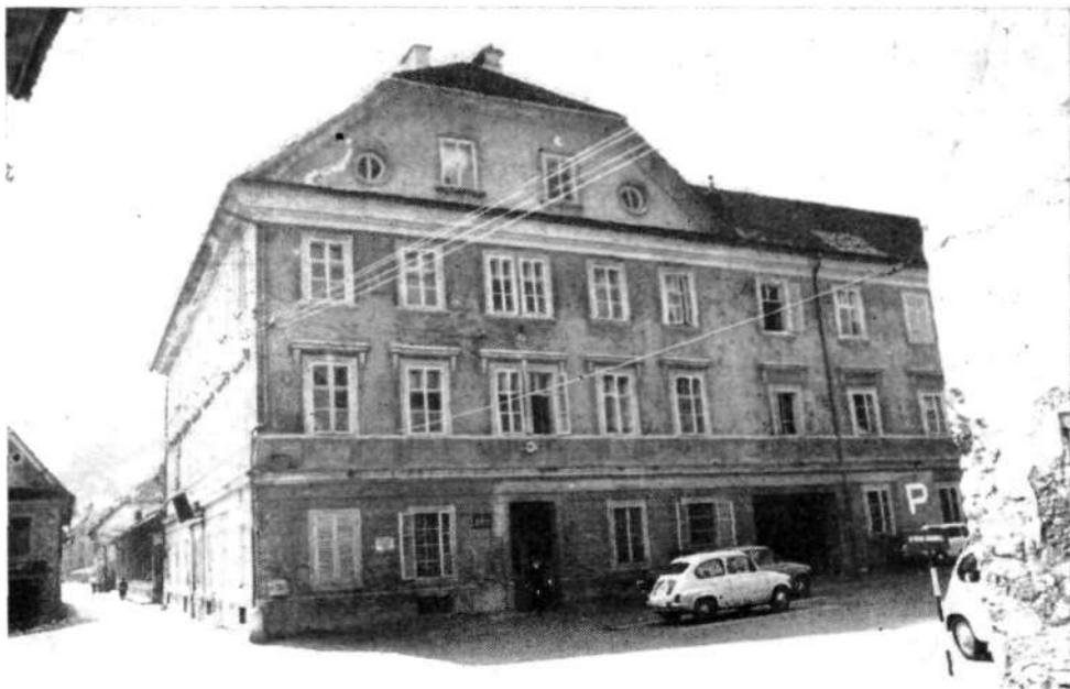
Poslopje občinske skupščine Skofja Loka

skupščine. Običajno se zbori volivcev sklicujejo po območju krajevnih skupnosti razen kandidacijskih zborov za volitve odbornikov, ko se sklicujejo po volilnih enotah.