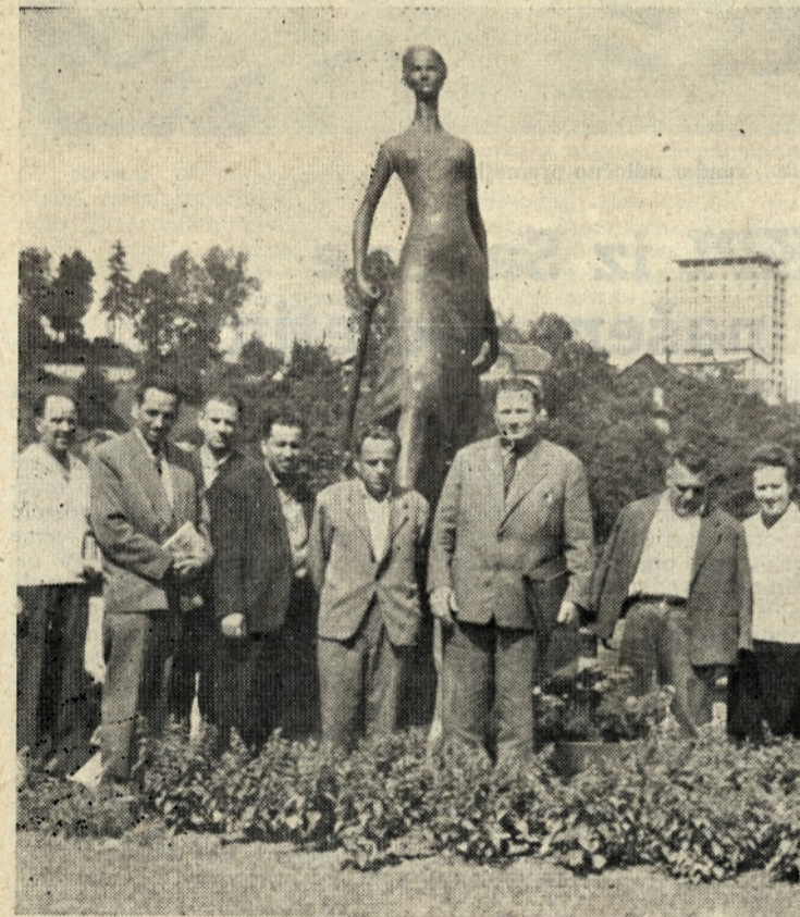
Nekdanji borci ob spomeniku