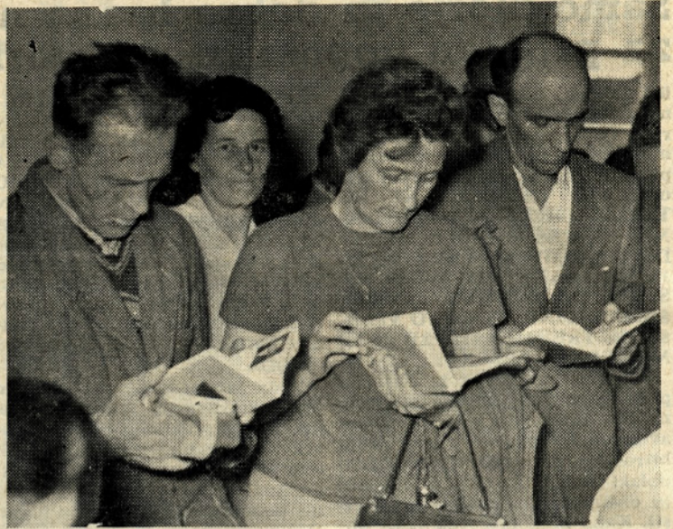
Borci so bili veseli darila, knjige