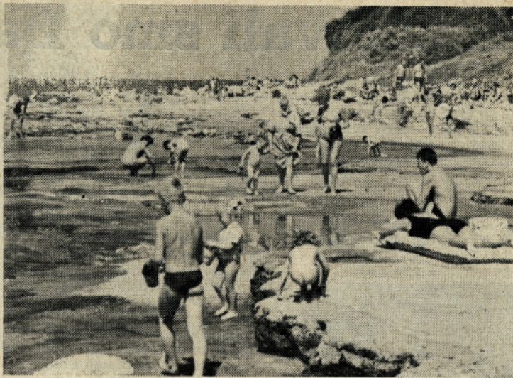
Na plaži v naselju Novigrad