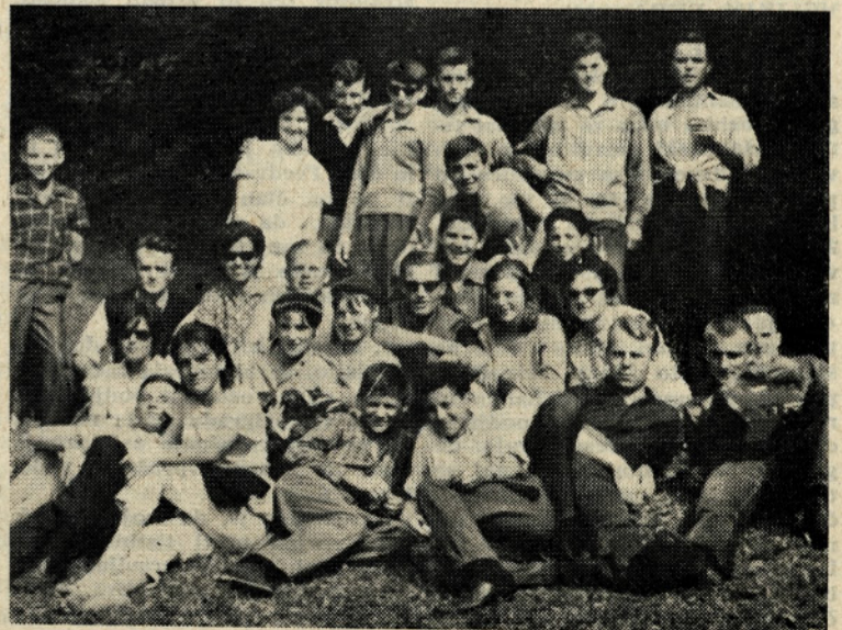
Udeleženci partizanskega pohoda