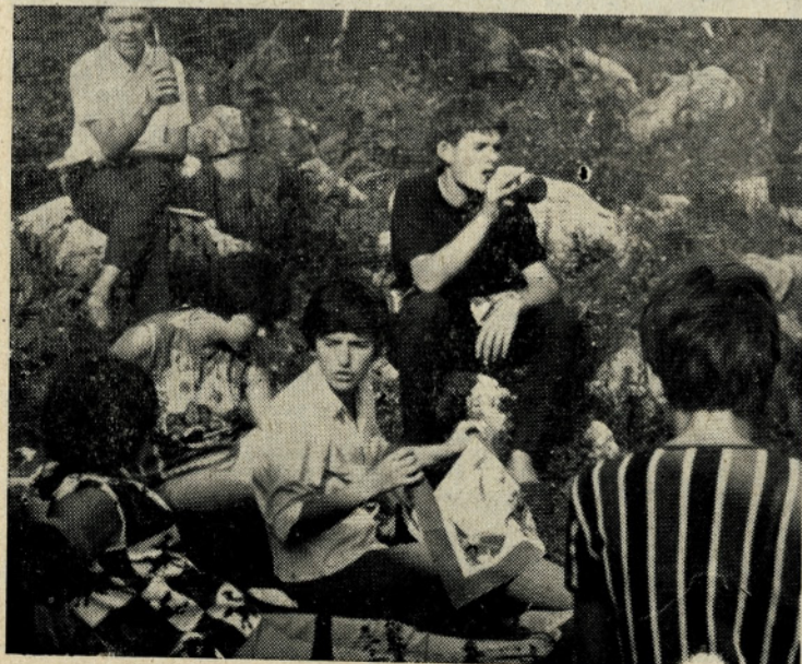
Gostje iz La Ciotat na Krvavcu