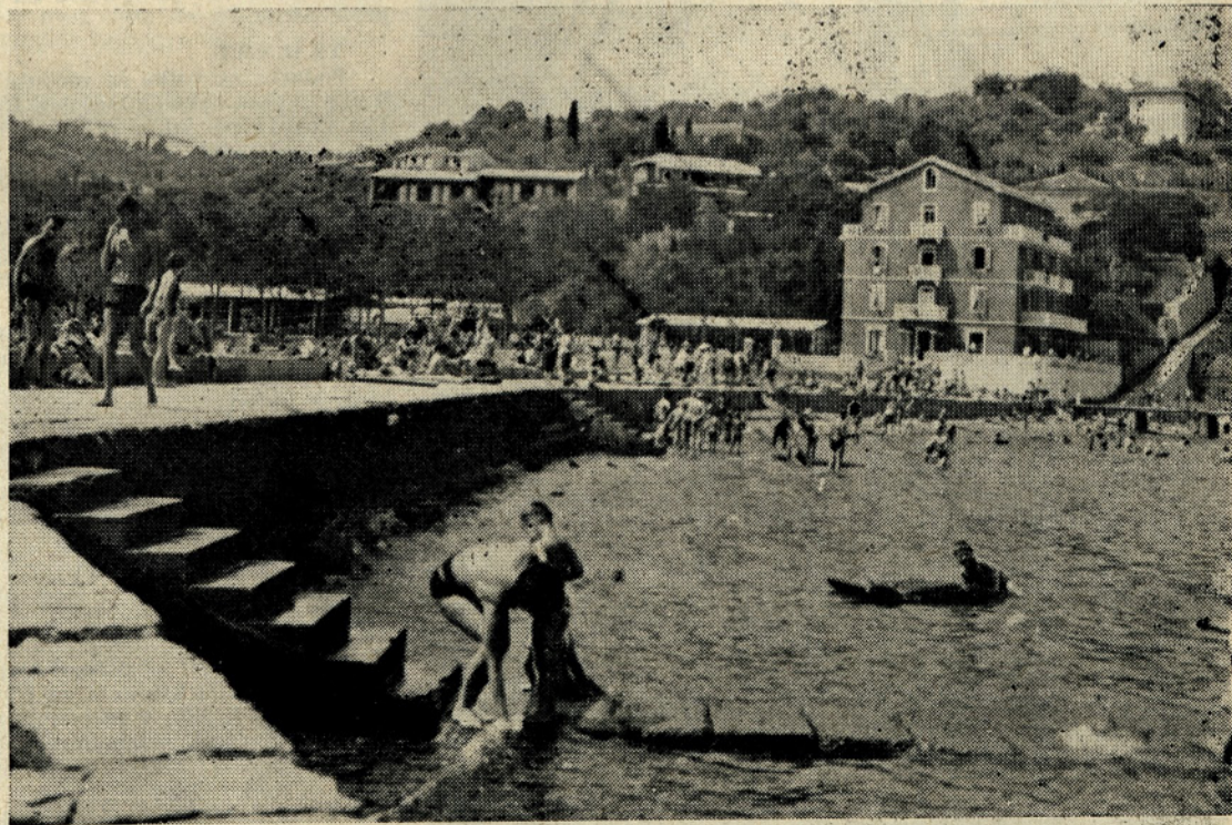
Pogled na plažo in dom v Fiesi