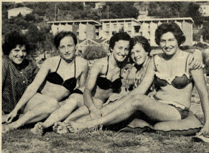
Tudi naše kuharice včasih uživajo kot zapeljive »EVE«