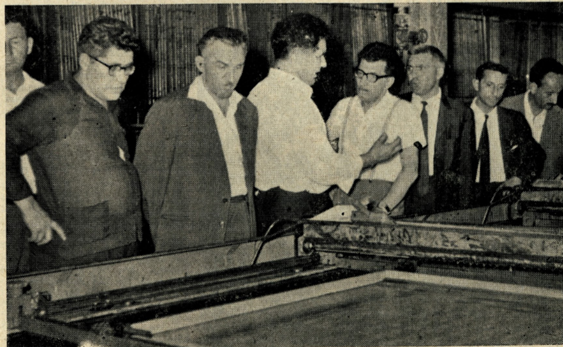
Gostje iz Savone si ogledujejo filmsko tiskarno