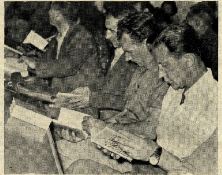
Tejč ki jo je napisal Rudi Pušenjak