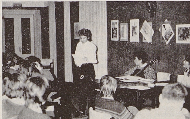
Med literarno-likovnim večerom SKK