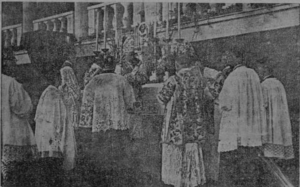
Pontifikalna sv. maša papeževega odposlanca na stadionu.