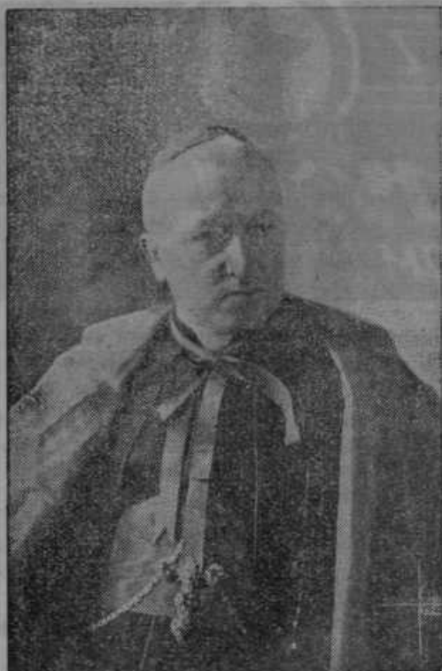
Zastopnik sv. Očeta na evharističnem kongresu v Ljubljani kardinal Avg. Hlond.

ji, gospodinje, delavstvo in vsi drugi, ki se zanimajo za ta potrebna vprašanja.