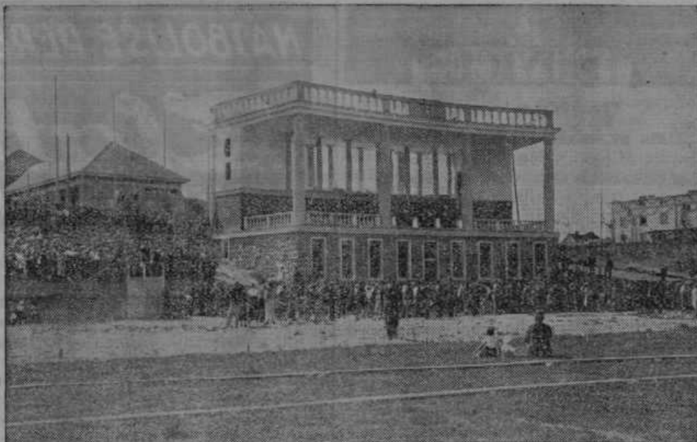
Tribuna na stadionu, kjer se je darovala slovesna sv. daritev dne 29. in dne 30. junija.

Okusno aranžirana izložba znane in ugledne tvrdke »TIVAR« v Prešernovi ulici ob priložnosti kongresnih svečanosti v Ljubljani. Pokazala je tvrdka »TIVAR«, kako visoko ceni ona pomen te lepe verske prireditve. 695