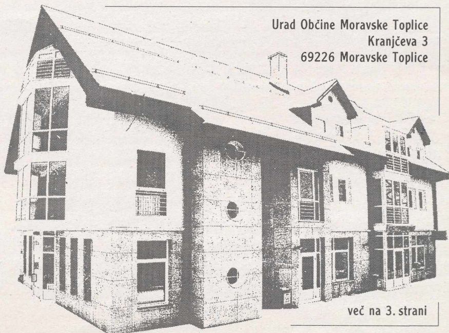
Urad Občine Moravske Toplice Kranjčeva 3 69226 Moravske Toplice

V Lipnici tokrat ob napovedi teh dveh dogodkov v osrednjih člankih govorimo še o Košičevih tednih kulture v krajevni skupnosti Bogojina, mladi govorijo o kugi 90-ih let – drogi, župan pa razgrinja svoj pogled na pomen, vlogo in možnosti delovanja lokalne samouprave.