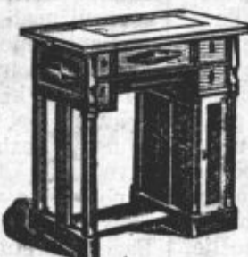
Večletna garancija! Pouk v vezanju brezplačen!

Jos. Petelinc, Ljubljana ob vodl. v bližini Prešernovega spomenika.