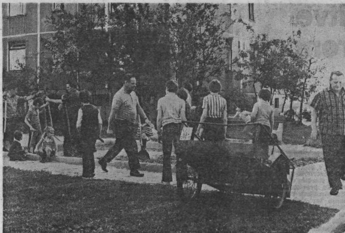
Očiščevalne akcije na Vodmatu so se udeležili stari in mladi