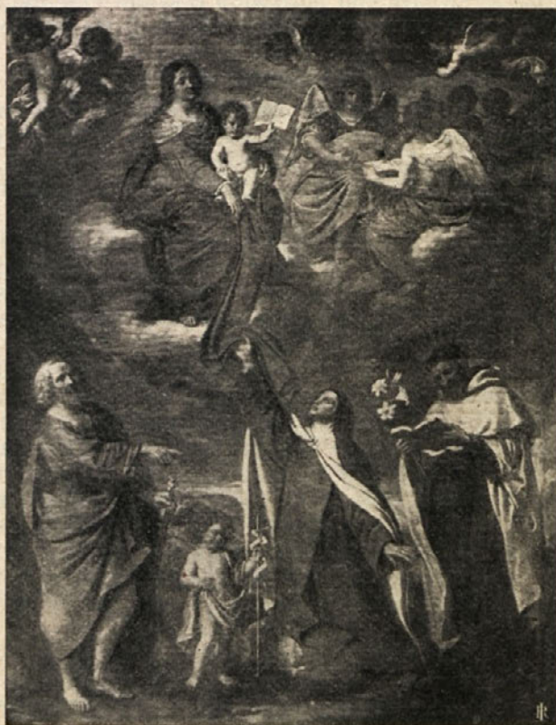
Sv. Terezija in sv. Janez od Križa

Res je sicer, da v trenutkih globoke molitve vsega tega ni prav nič čutila, da so vsi dvomi odpadli, da ni bilo v njej nobene bojazni, ampak en sam velik pogum. Kakor hitro pa je prišla zopet v stik s sveto, potem je vsa nesrečna prosila Boga, naj ji te milosti, ki so ji prizadejale toliko muk in toliko preganjanja, odzame. Iskreno je prosila vsa tista plemenita in dobra srca, ki so jo ljubila in ji bila odkritosrčno vdana in so verjela njenim besedam, naj se z njo združijo v molitvi, da bi bila te bridkosti