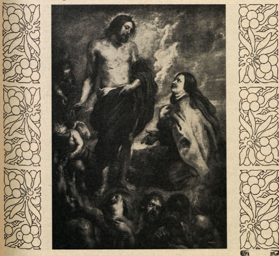
Sv. Terezija se razgovarja z Jezusom

Sprva je Terezija mislila, da so tudi ta videnja le plod njene bogate domišljije, toda Gospod se je izkazal tako ljubeznivega in tako skrbečega, da jo je o tej resnici prepričal, da je izgubila vsak dvom. Zakaj tudi če bi leta in leta poizkušala z domišljijo predstaviti si toliko lepote, bi tega nikakor ne zamogla in tudi ne znala, in jasnina sama in odsev ter žar te nepopisne lepote presega vse, karkoli si morem na svetu lepega predstavljati. To ni morda sijaj, ki človeka oslepi, temveč mila jasnina in čisto