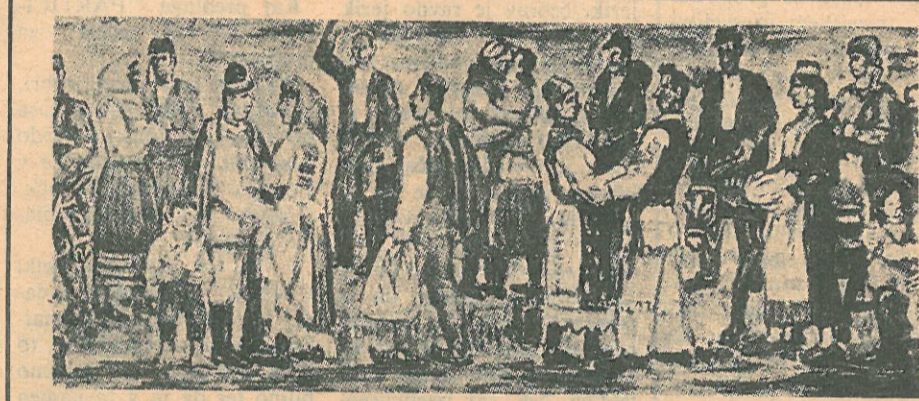
Joko Knežević: »Oproštaj« (detalj)

JEDAN OD NAJVEĆIH SREDNJOVEKOVNIH SPOMENIKA