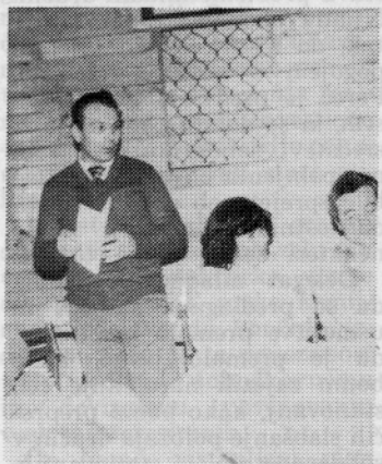
Poročilo nadzornega odbora je podal tov. Povše

Uvodoma je predsednica tov. Šolarjeva podala poročilo