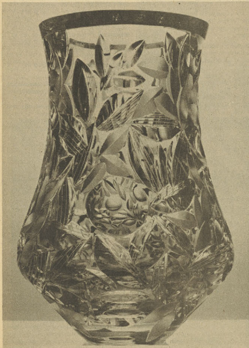
Unikatna kristalna vaza... Kdo bi si je ne želel?

Okvirni plan Steklarne za leto 1987 bomo morali med letom zagotovo spremeniti. Rebalans plana bo potreben, ker so gibanja v začetku leta drugačna, kot so bila napovedana z resolucijo in kot smo jih upoštevali pri sestavi plana. Prav tako tudi intervencijski zakon in njegove kasnejše dopolnitve še vedno ne prinašajo nobenih spodbujevalnih usmeritev v delitvi osebnih dohodkov. Predvidevamo, da bo treba pripraviti najmanj en rebalans plana, saj je v sedanjih skoraj ekonomsko nelogičnih razmerah, planira-