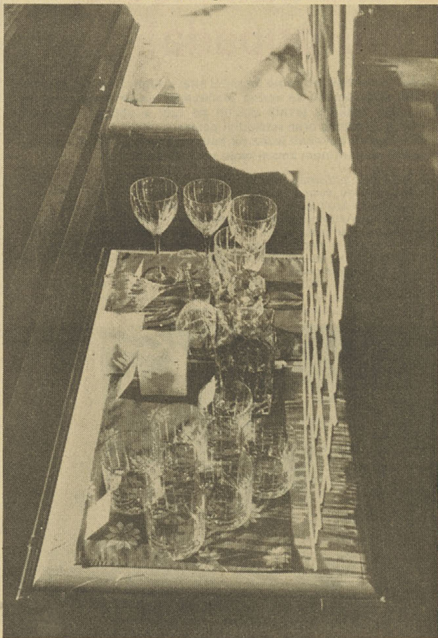
Modeli serije Galleria v izložbenem oknu trgovine Ambient v Mariboru