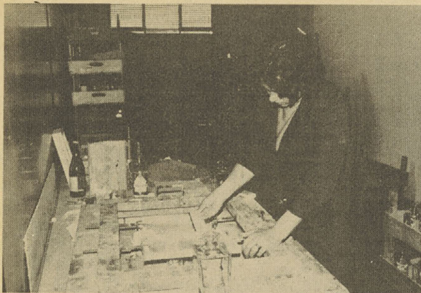
Označevanje steklenic s sitotiskom – foto Z. novak

že sodelujejo v ansamblu, bo še po 6 ur časa tedensko ali dodatnih 288 ur.