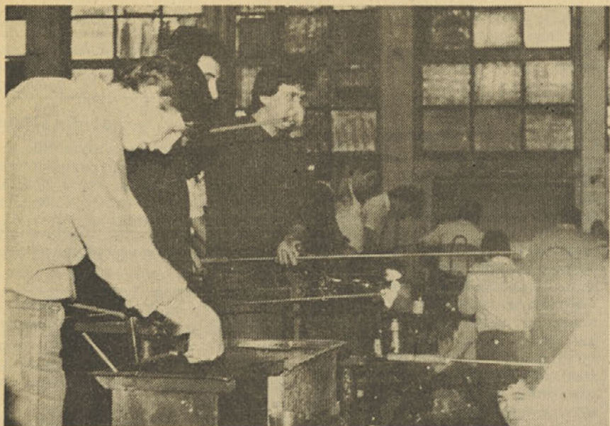
Kako vzbuditi zanimanje mladih za steklarski poklic?

temperature so tudi v tem letnem času dokaj visoke.«