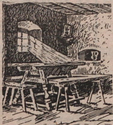
The typical Slovenian kitchen in the old country with the heavy wooden table and "God's Corner" in place.