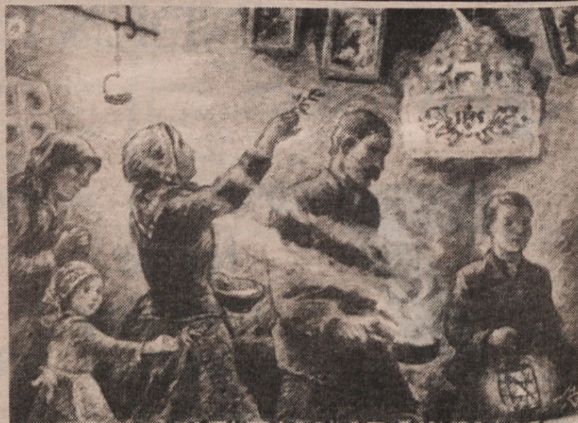
VESEL BOZIC IN SRECNO NOVO LETO!