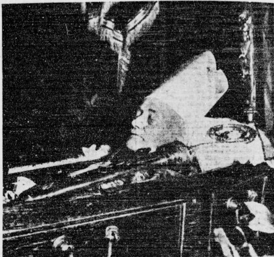
Nadškof Jeglič na mrtvaškem odru

Pol stoletja po rojstvu Antona Martina Slomška se je rodil Jeglič. Na pol stoletja eden! Vladika Anton Martin Slomšek je bil najstarejša posebnost slovenskega narodnega genija. Skladen značaj, v katerem so se harmonično družile vse duševne in telesne vrline njegovega rodu, širok vsostranski, vzgojitelj, pisatelj, preporodi-