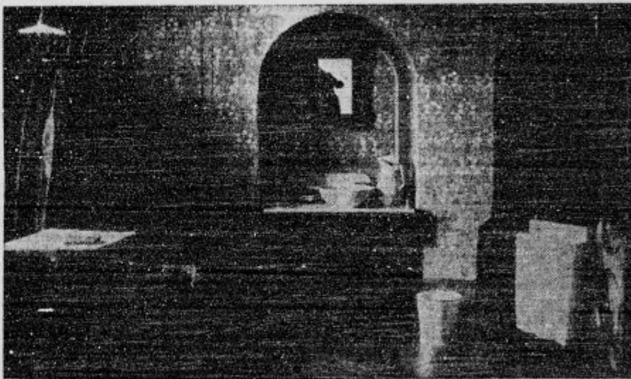
Soba v Stični, kjer je nadškof Jeglič umrl