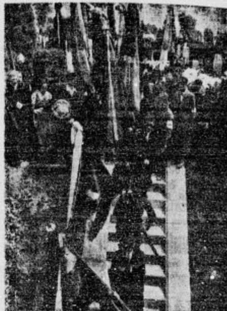
Zastave prosvetnih organizacij se klanjajo nad grobom Jegličevim

d Pa pravije, da je strah v sredi votel. Če je vse res, straši že dva meseca v hiši kmeta Tordnika v Drinovcih pri Brčkem. Gospodar je pred dvema mesecema umrl, nakar je začelo strašiti. Domači so sredi noči začuli trkanje po oknih, potem je pa strašilo