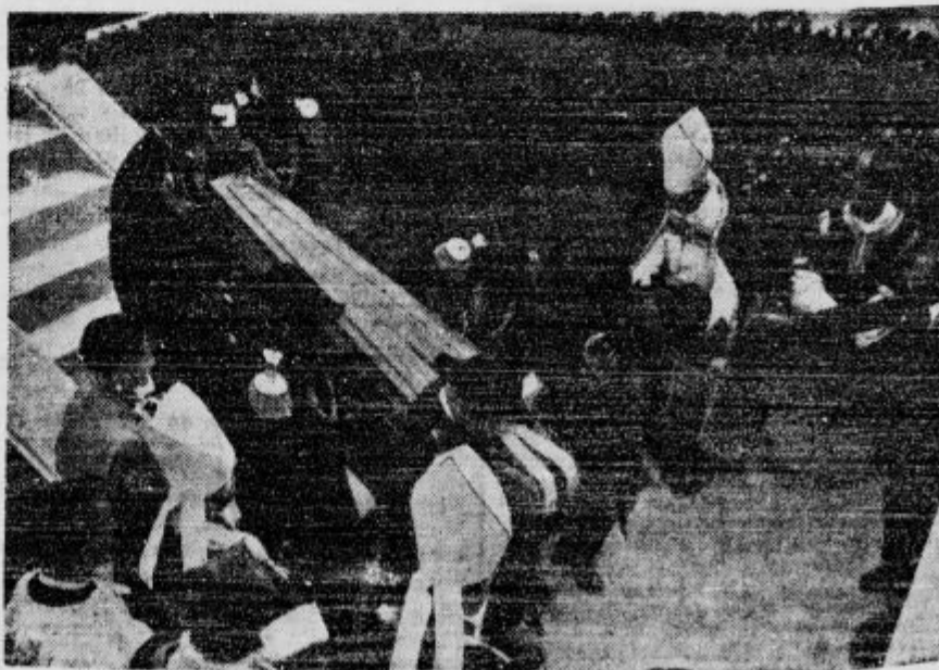
Krsto velikega pokojnika neso v grobnico

d Ugibanja o razgovorih v Zagrebu. Te dni je odpotoval v Zagreb dr. Milan Gavrilović, ki ga je poslala zemljoradniška stranka k dr. Mačku. Med obema politikoma se vršijo razgovori, ki naj privedejo do načelnega sporazuma. Zemljoradniška stranka g. Joce Jovanoviča, ki je, kakor znano, del tako zvane