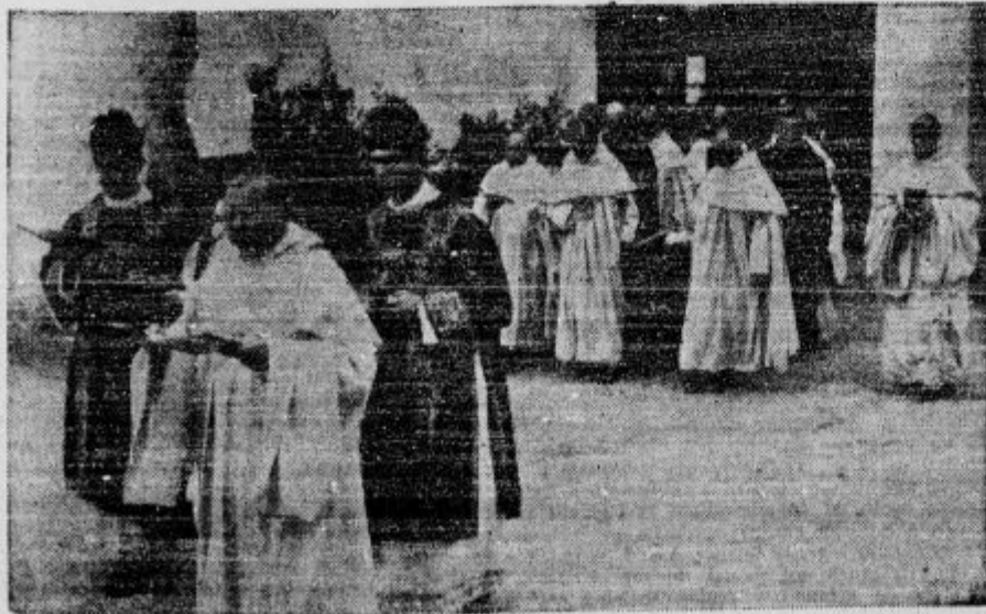
Beli menihi nesó krsto s dr. Jegličevim truplom v stiško baziliko