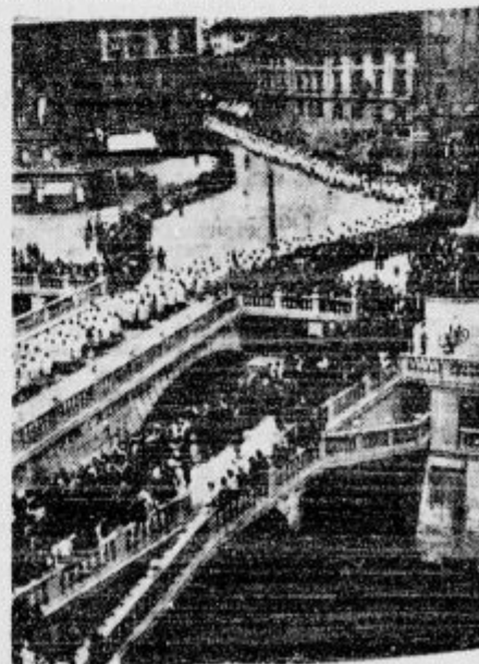
Dolgi spreved duhovščine gre čez trimostje in Marijin trg.