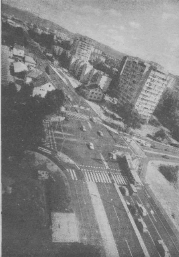
Gledano od daleč, je pogled na Zaloško cesto prav imeniten. V ravnici pa je še mnogo stvari neurejenih.