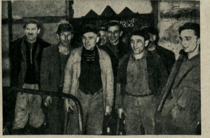
Skupina rudarjev pred jamo

Dogodki v Iraku so močno izne- nadili vlado v ZDA pa tudi vlade nekaterih drugih zahodnoevrop- skih dežel. To je bil predvsem vzrok za izredno živčno reakcijo, kateri smo bili priča v preteklih tednih, ki so sledili revoluciji v Iraku. Pomirjenje v Libanonu, do katerega je prišlo, odkar je bil iz- voljen za predsednika republike dosedanj načelnik generalnega štaba libanonske vojske, general Šehab, omogoča, da postane za- hteva, da se ameriške čete umak- nejo iz te majhne dežele, realna. Pozornost namreč vzbuja dovaja- nje vedno novih in novih čet, če- prav jih je že sedaj več, kakor jih je potrebno za vzdrževanje reda. To vzbuja na Bliznjem vzhodu ob- čutek negotovosti in sum, da Ame- rikanci pripravljajo še nekaj druge- ga in ne samo okupacijo Liba- nona. Novi predsednik, general Šehab, je objavil svoj politični pro- gram ter med ostalim zahteval, da se ameriške čete nemudoma uma- knejo iz Libanona. Ko so prišle v deželo, so prišle, kot trdijo, na po- ziv predsednika republike Liba- nona, sedaj jih ta odslavlja. Ali bodo enako hitro tudi zapustile deželo? Verjetno ne.