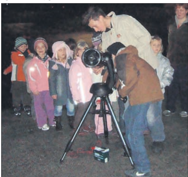
Malčke iz šmarskega vrtca je teleskop tako pritegnil, da bo nekdo od njih gotovo postal astronom.