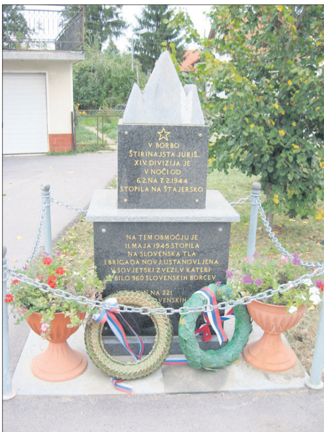
Spomenik v Sedlarjevem, ki spominja na prihod XIV. divizije na Štajersko.