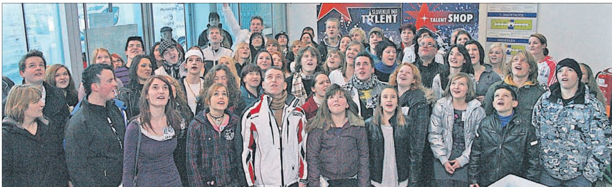
Vsi kandidati gledajo proti zvezdam. Bo zasijala za koga, ki se je prijavil na avdiciji v Celju?