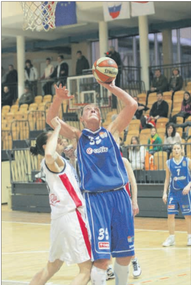
Rankica Šarenac vztrajno lovi nekdanji občutek za vrhunsko igro.