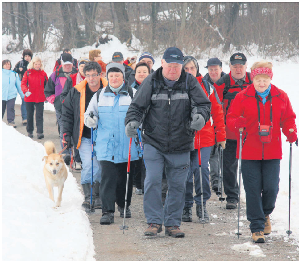
Utrinek s sobotnega pohoda