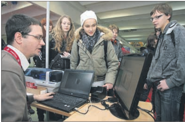
Eden redkih delodajalcev, ki na razstavnem prostoru ni sameval. Bodo če kadre je pač potrebno nekako pritegniti. Na primer s tiskanjem njihovih prstnih odtisov.