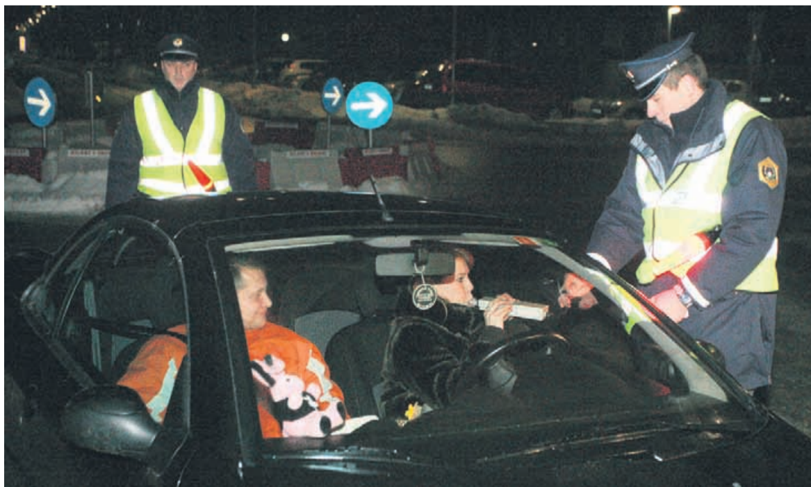
Voznica, ki je pihala, je vozila po pravilih in trezna. »Nikoli ne pijem alkohola, preden sedem za volan.«