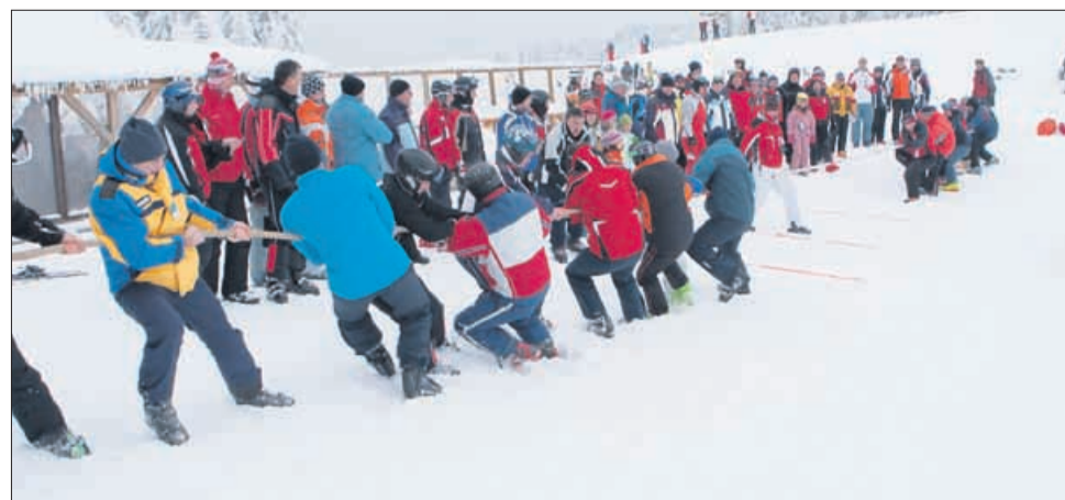
Rudarski reševalci so bili boljši v veleslalomu in vlečenju vrvi, gorski reševalci pa v vožnji s pležuhi, medtem ko so si pri nujni prve pomoči točke razdelili.

Na podlagi 50., 60. in 96. člena Zakona o prostorskem načrtovanju - ZPNačrt (Uradni list RS, št. 33/07) in 27. člena Statuta Mestne občine Celje (Uradni list RS, št. 41/95, 77/96, 37/97, 50/98, 28/99, 117/00, 108/01, 70/06 in 43/08) župan Mestne občine Celje s tem