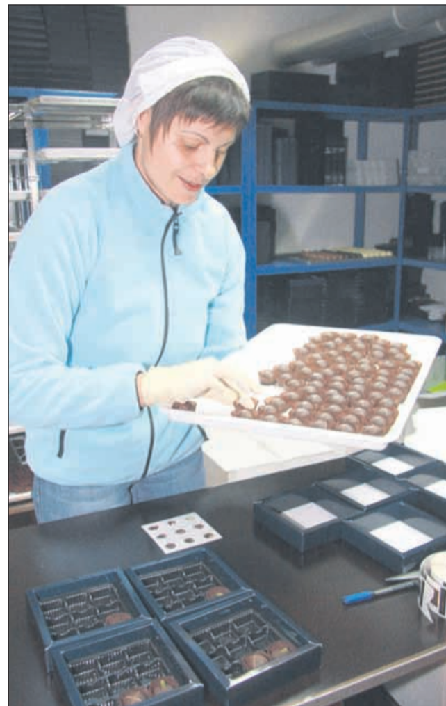
Pralineji na sto in en način

Čokolada je priljubljena hrana, ki služi kot dodatek, okras ali sladica. Vse skupaj se začne z zorenjem kakavovih zrn, ki jih dodobra obdelajo, preden jih pošljejo v tovarno, kjer se izdelava nadaljuje. Najboljšo in najkvalitetnejšo čokolado čaka še nadaljnja obdelava, imenovana »conching«. Poseben stroj nežno tresse čokoladno zmes nekaj dni. Ta čas razvijejo okus čokolade in jo zmečkajo, odstranijo grenak okus in zmes postane gladka. Med tem postopkom dodajajo različne okuse, kot so vanilija, cimet in klinčki. Čokoladna masa je tako pripravljena za naslednji postopek, in sicer jo dajo v lonce za temperiranje, kjer jo premešajo in nato previdno ohladijo, čeprav je še vedno v obliki tekočine.