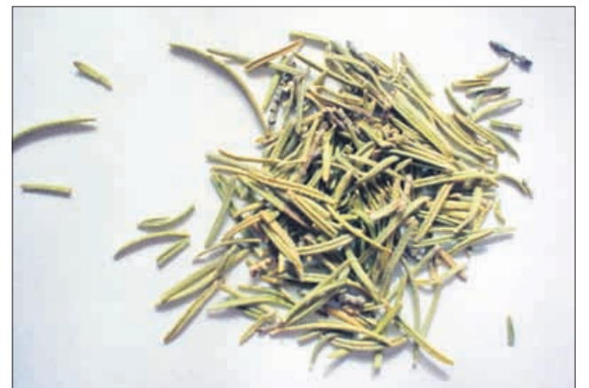
NL Proti prhljaju zaleže tudi rožmarin.