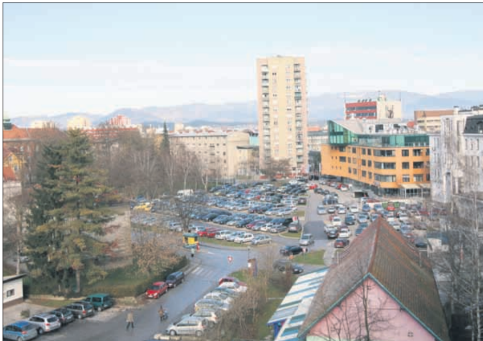
Na parkirišču za Knežjim dvorcem naj bi v prihodnje zrasla garažna hiša, s čimer bi v središču mesta zagotovili zadostno število parkirnih mest.

Toda še prej načrtujejo gradnjo garažne hiše na parkirišču za Knežjim dvorcem. Zaradi predvidenih posegov na mestu nekdanjega Kina Dom se bo namreč zunanje parkirišče precej skrhilo. Dodatna parkirna mesta želi MOC na tem mestu zagotoviti z garažno hišo, za katero želijo še letos