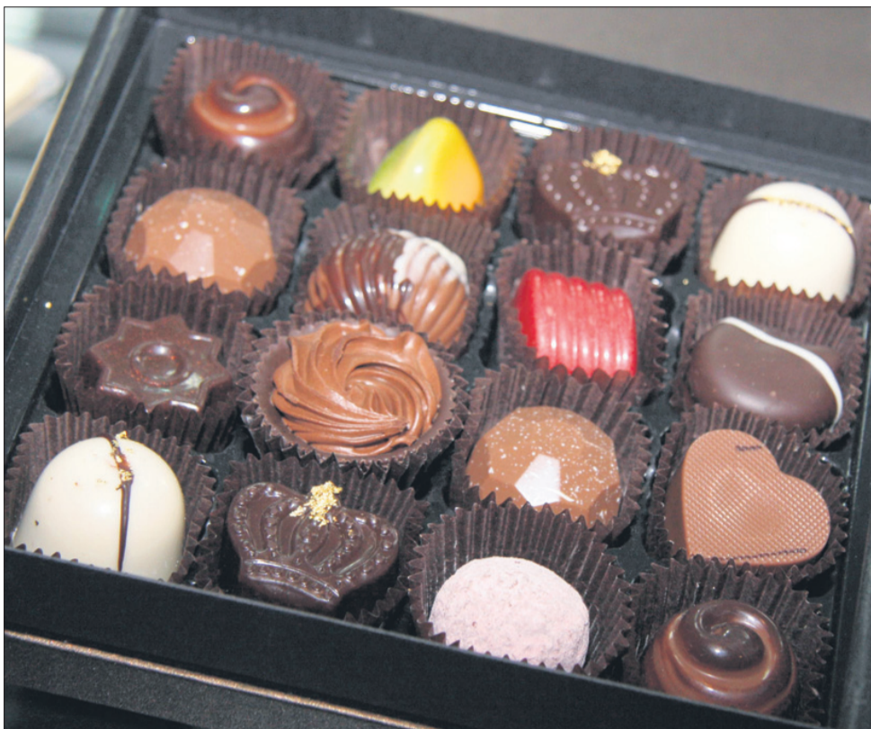
Zadnja stopnja – sladko pakiranje