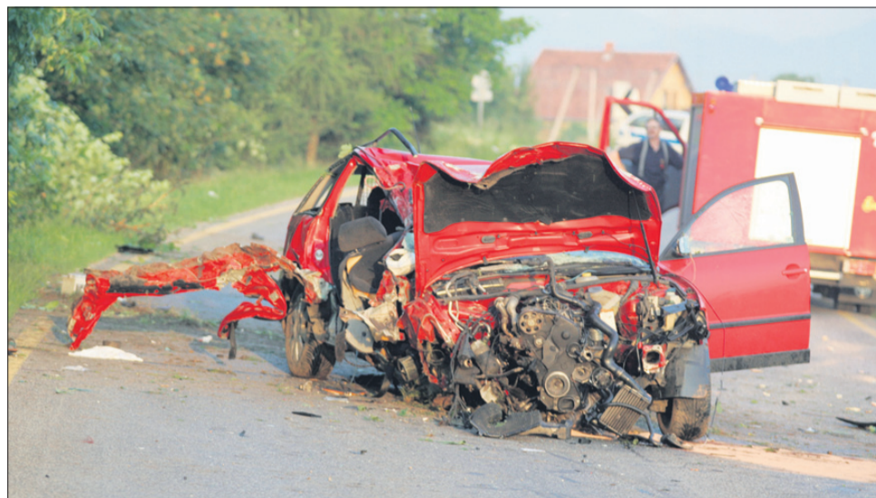
Avtomobil, v katerem je umrla naša novinarka, šest mladih pa je bilo poškodovanih.

ni spomladi, obtožnica je bila vložena 25. maja, torej le dan pred obletnico novinarke smrti in le nekaj dni zatem, ko smo na celjskem tožilstvu spraševali, kaj je s primerom ... Od maja lani torej čakamo na obravnavo. Sodnik, ki bo zadevo vodil, je sicer znan po svoji korektnosti in tudi po hitrih sojenjih. Kljub temu pa smo verjetno s svojimi vprašanji na sodišču že malo tečni. Minuli teden se je na celjskem sodišču namreč končalo sojenje šentjurski novinarke zaradi žalitve, njeno kaznivo dejanje se je zgodilo leta 2008. Laično se nam pač zdi neverjetno, da se sojenje, v katerem zaslišujejo pol nekoga kraja o govoricah, kdo je s kom spal in s kom ne,