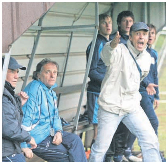
Pred strokovnim štabom NK Simer Šampion je še veliko živciranja v spomladanskem delu 3. SNL - vzhod, v Velenju pa je imel razlog le za zadovoljstvo.

Tako v prvem delu kot v drugem so bili boljši, za njihovo veselje je poskrbel To-