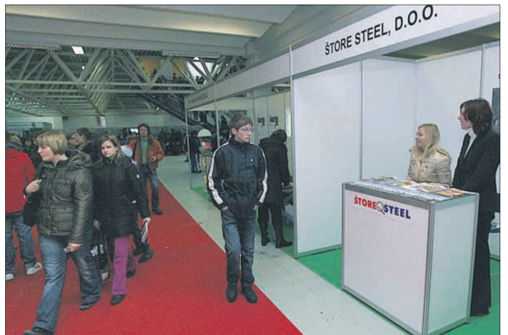
Določenim razstavljavcem so se mladi izognili v velikem loku. Pa čeprav v takšnih podjetjih vse še zdaleč ni črno in umazano.

Na podlagi 50., 60. in 96. člena Zakona o prostorskem načrtovanju - ZPNačrt (Uradni list RS, št. 33/07) in 27. člena Statuta Mestne občine Celje (Uradni list RS, št. 41/95, 77/96, 37/97, 50/98, 28/99, 117/00, 108/01, 70/06 in 43/08) župan Mestne občine Celje s tem