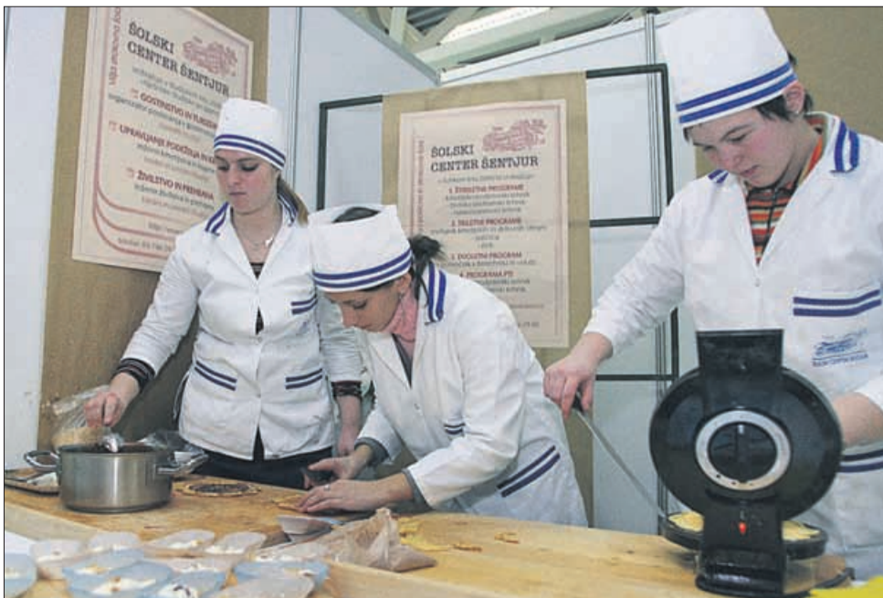
Ne verjamem, da se bo toliko otrok vpisalo na Šolski center Šentjur, kolikor jih je v smer njihovega »štanta« privedel nos. »Sveže pečeno. Poskusite.«