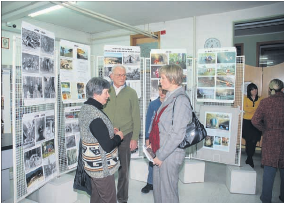
Jamarji kluba Črni galeb iz Prebolda so lani obeležili 40-letnico delovanja. Ob tej priložnosti so si podarili knjigo z naslovom Črni galebi pišejo. Na ogled so v žalski knjižnici med drugim postavili tudi fotografije.