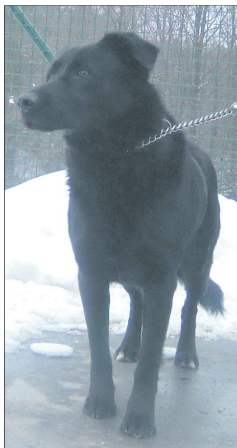
Sicer še nisem dolgo tukaj, a si že močno želim nove prilike pri dobrem človeku. In da se še malo pohvalim, sem mirnega karakterja, neagresiven, malo še plašen, a željan družbe ljudi. (7736)