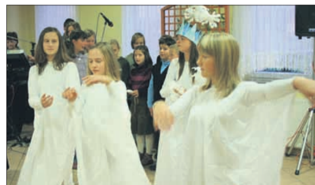
Nastop vokalne in plesno-gledališke skupine