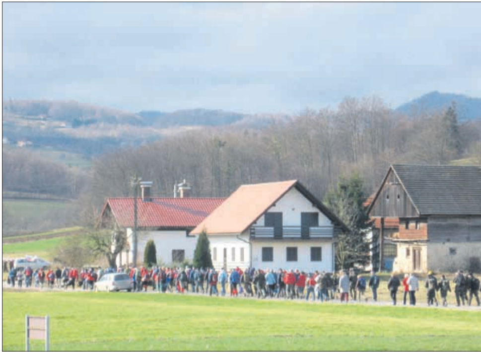
Med razlogi za prestavitev proslave iz Sedlarjevega naj bi bilo tudi morebitno slabo vreme. Pohod, ki je v okviru proslave, je v zadnjih letih potekal tudi v tako lepem zimskem vremenu.