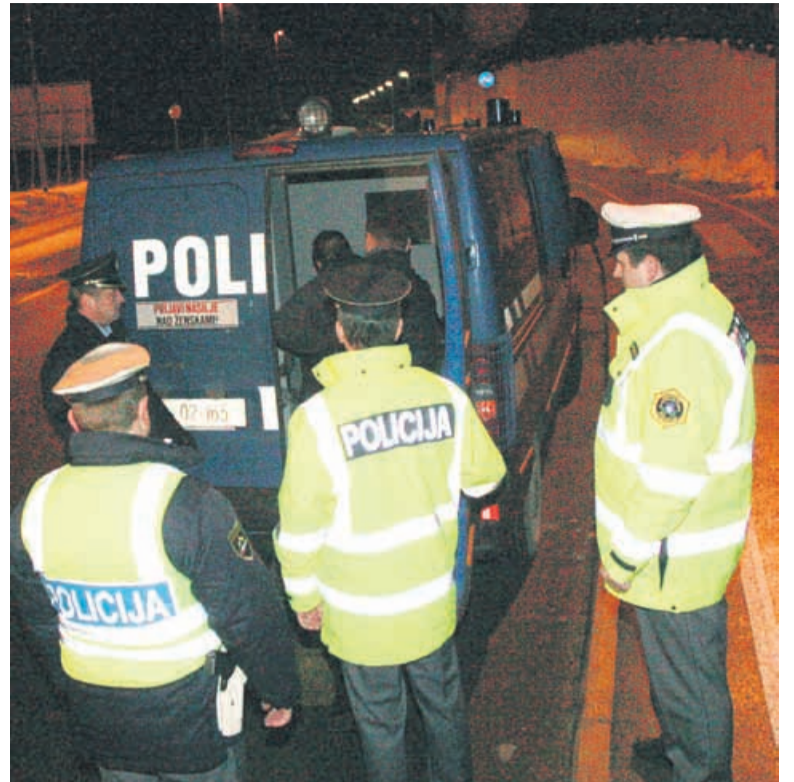
Takole so v »marico« spravljali kričača.