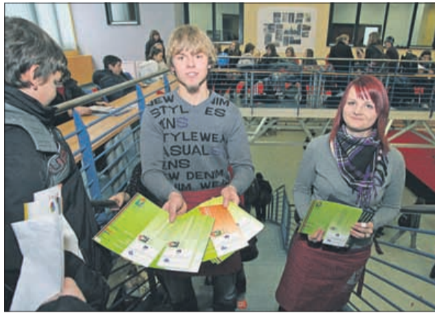
Tudi nekateri srednješolci so imeli pouka prost dan. So imeli preveč dela z »delanjem reklame« za svojo šolo.