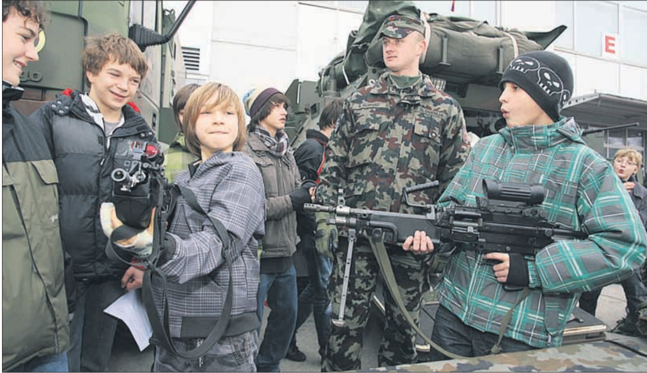
»Vojska!« Takšen je bil enoglasen odgovor fantov na vprašanje, kaj jim je bilo na sejmju najbolj zanimivo. »Tra-ta-ta-ta!«