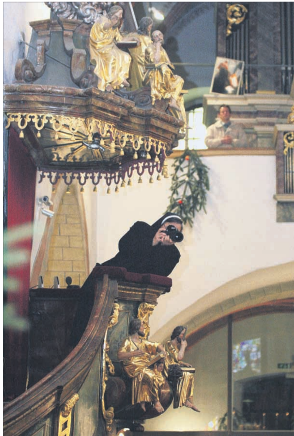
Med poslovilno mašo škofa Antona Stresa