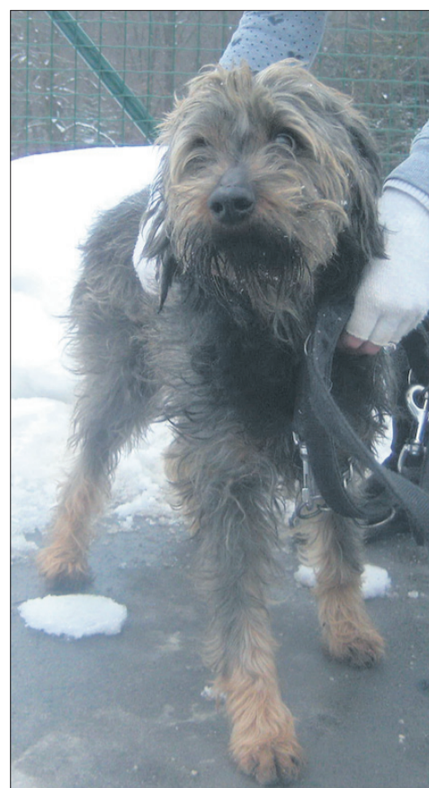
Uh, dolgo časa sem že tukaj. Ko sem prišla, je bilo še poletje, zdaj smo že krepko v zimi. A upanja, da bom našla nov domek, mi nikoli ne zmanjka. (Štefi)

Uradne ure: od ponedeljka do petka od 8. do 16. ure; ogledi psov: od ponedeljka do petka od 12. do 16. ure. Sprehajanja po dogovoru in predhodni najavi po telefonu, preko e-maila nina.starkel@gmail.com ali preko Facebook skupine Zonzani od ponedeljka do petka od 12. do 16. ure, ob sobotah od 10. do 12. ure. Telefon: 03/749-06-00; internetni naslov www.zonzani.si