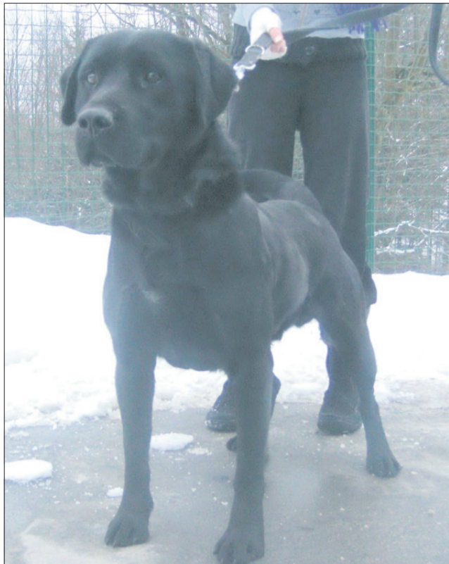
Sem labradorec s čipom, ki pa ga žal ni v Centralnem registru psov. Najden sem bil na Opoki v Štorah in sem zelo, zelo prijazen. Želim si nazaj k lastniku, če pa se najde kdo, ki bi mi nudil nov dom, se tudi ne bom pritoževal. (7738)

Če je žival poškodovana, morate nemudoma poklicati zavetišče, ki ima podpisano pogodbo z občino, na območju katere ste žival našli. Pravilnik o pogojih za zavetišča za zapuščene živali namreč določa, da mora zavetišče v roku štirih ur poskrbeti za namestitev poškodovane živali. Če pa žival ni poškodovana, svetujemo, da najprej malo povprašate v bližnji okolici, če jo kdo pogreša, morda objavite oglas na lokalnem radiu, lahko pa jo odpeljete k veterinarju, da preverijo, če ima morda čip. Torej če je le mogoče, malo počakate, preden začnete klicati v zavetišče, da ste našli žival. Tri dni je namreč zakonsko predpisan čas, da predate najdeno žival pristojnemu zavetišču. V tem času lahko najdenčku sami poišče-