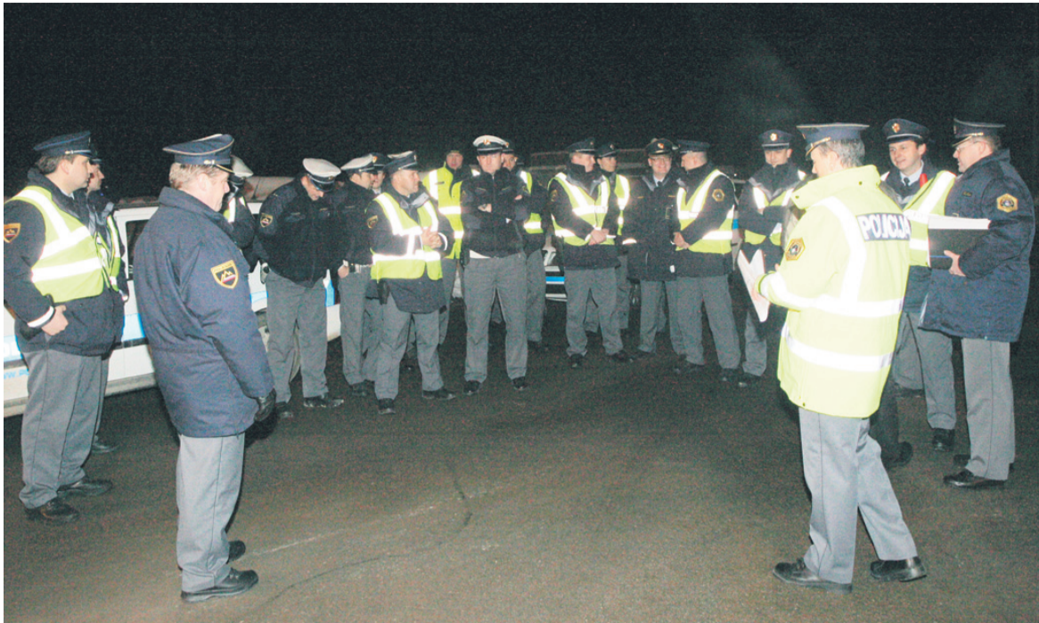
Zbor policistov. Vodilni so jim šele tik pred odhodom povedali, na kateri lokaciji bodo izvajali nadzor prometa.