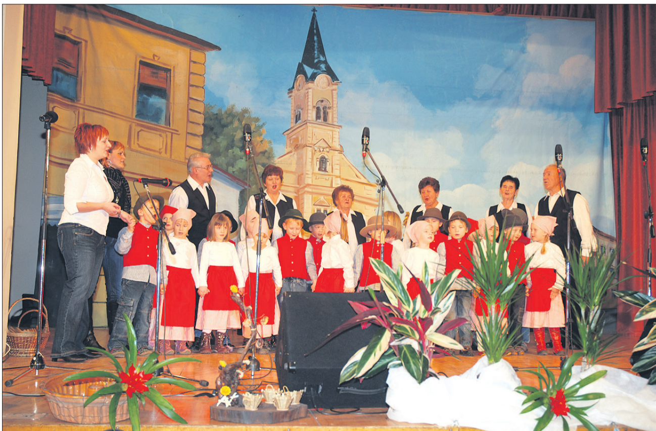
Prijatelji 6-Še tradicijo ljudskega petja uspešno prenašajo na najmlajše rodove.