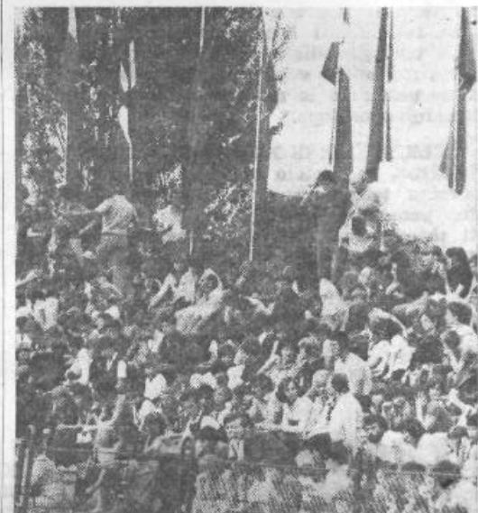
Polne tribune ...