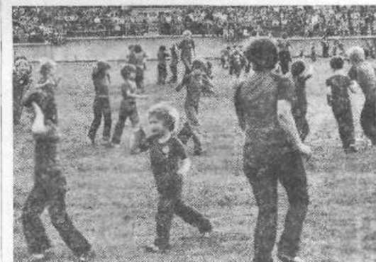
Najmlajši so navdušili ...