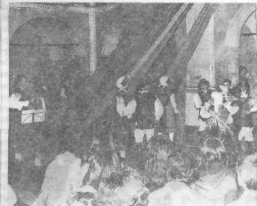
Uspešni glumaški večeri v Goričanah