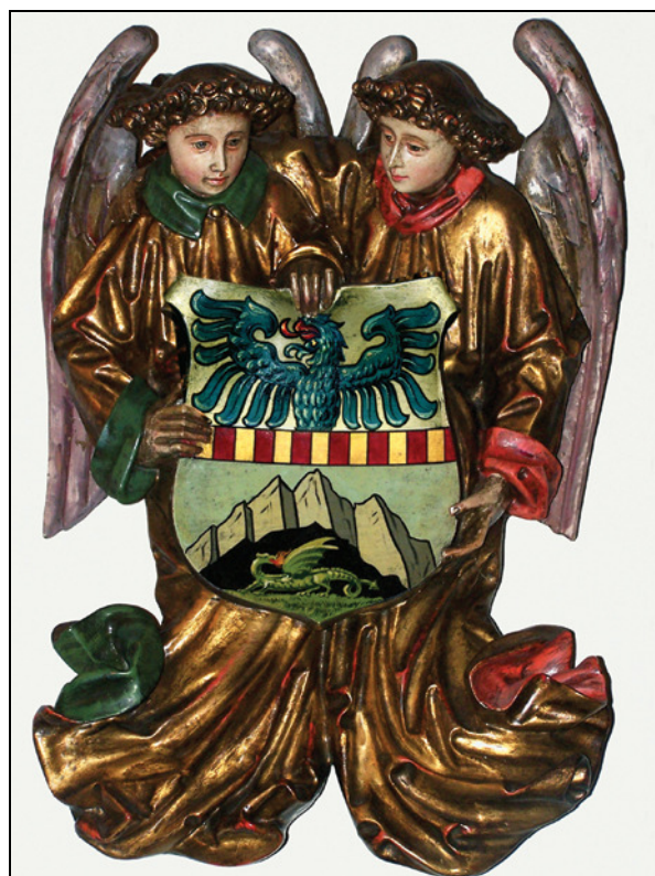
Grb Ksenije Gorup Hribar na gradu Strmol (foto: Tatjana Rodošek, Ljubljana).