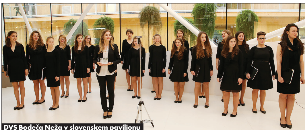
DVS Bodeča Neža v slovenskem paviljonu

Novi deželni predsednik Sveta slovenskih organi-