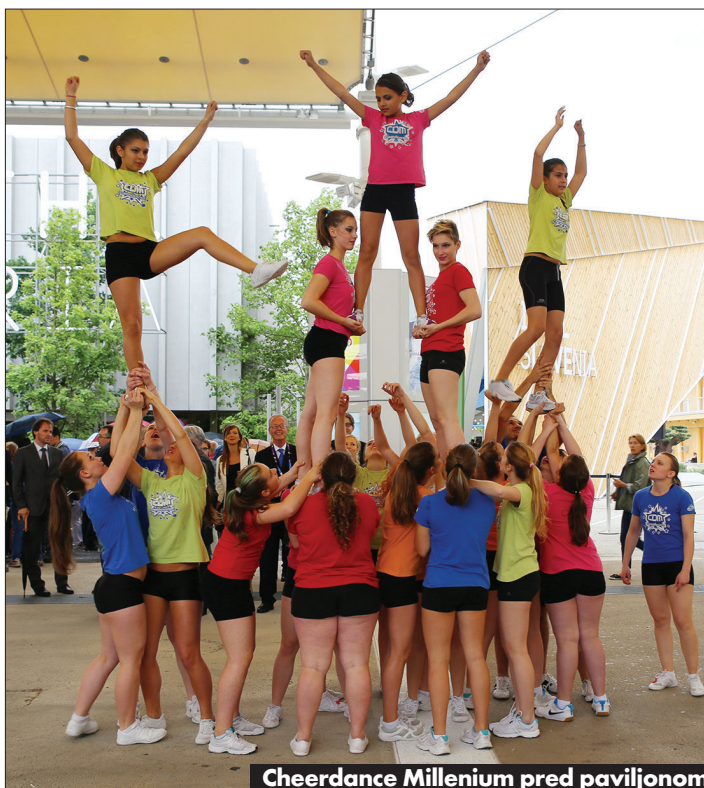
Cheerdance Millenium pred paviljonom

Paviljon je že v dopoldanskih urah obiskal minister za Slovence v zamejstvu in po svetu Gorazd Žmavc. Navzoče je nagovoril in s ponosom izrazil zadovoljstvo, da se je na svetovni razstavi predstavila tudi slovenska skupnost v Italiji. Kot piše v sporočilu za javnost iz urada za Slovence v zamejstvu in po svetu, je minister poudaril, da v tem trenutku pomembnost povezave matične države Slovenije in zamejstva izpričuje aktivna predstavitev zamejskega življenja skozi Okuse Krasa, ki govori o pomembnosti tipičnih proizvodov in kulinarne teritorije za vrednotenje tradicije in večanja prepoznavnosti čezmejnega Krasa. S tem se ohranja slovenska identiteta skozi kulinariko in tipične proizvode naše slovenske zemlje. Pri tem igra nenadomestljivo vlogo SDGZ, saj je povezoval gospodarstva v čezmejnem prostoru - na enogastronomskem področju - ključna dejavnost povezovanja gospodarstev obeh držav, je še dejal minister Žmavc, ki so ga pri ogledu med drugimi spremljali veleposlanik Republike Slovenije v Rimu Iztok Mirosič, generalna konzulka RS v Trstu Ingrid Sergaš, konzulka Eliška Kernič Žmavc, podpredsednik deželnega sveta FJK Igor Gabrovec in drugi. Zraven je seveda bila generalna komisarka Sekcije RS za Expo Jerneja Lampret. Predstavitev kraških vinskih in kulinarčnih