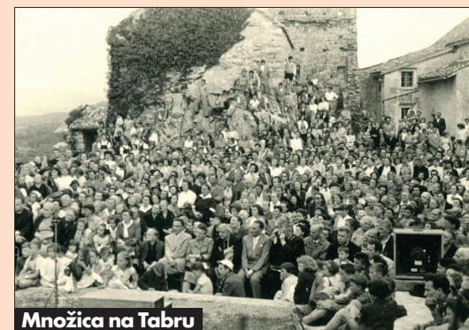
Množica na Tabru

Pri prosvetnem delovanju na Repentabru ne