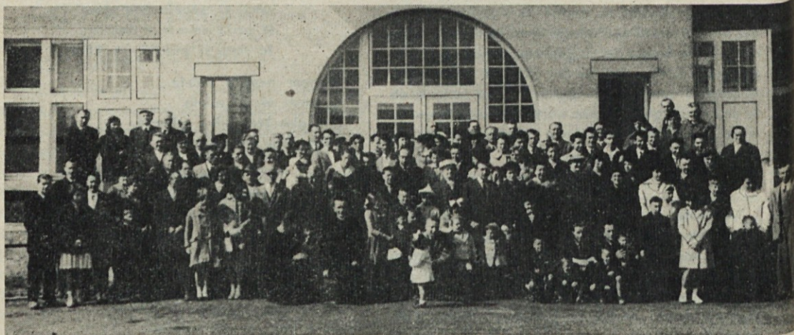
Slovenci iz Waterscheja in okolice po velikonočni službi božji