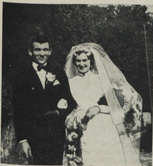
Novoporočenca iz Luzancy

LOIRET. — Slovenci v Loiretu delamo in se tru-dimo, kot vsi drugi. Na belo nedeljo smo se zbrali