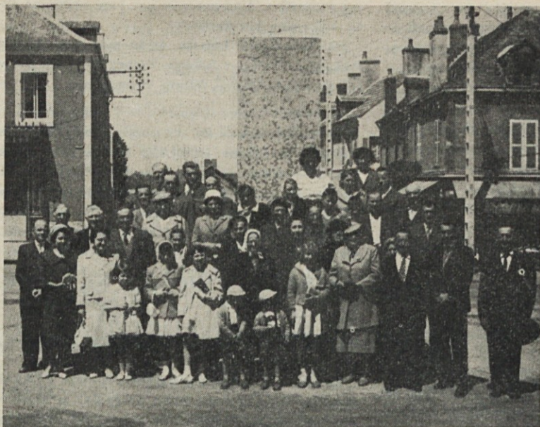
Slovinci iz La Machine v Franciji vas pozdravljajo.

Drugih novic zaenkrat nimamo, sedaj so pred nami poletni meseci in mnogi se že veselimo, da bomo zopet obiskali svoje domače kraje.