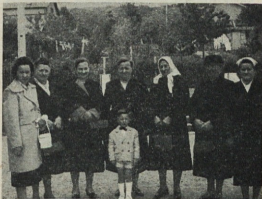
Nekaj Slovenk iz La Combelle v Franciji.