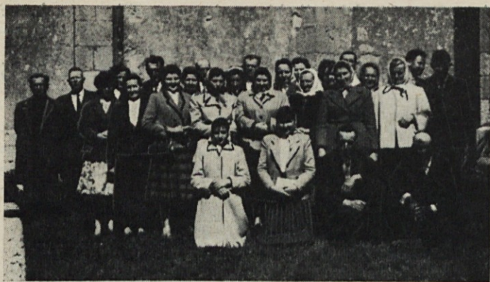
Slovenci iz Loiret (Francija)