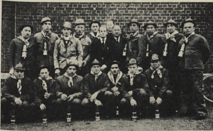
Skupina belgijskih rudarjev, zbrana po pogrebu rojaka Gregorčiča v Obourg pri Monsu. Od desne na levo: Prvi štirje in zadnji v zadnji vrsti so Slovenci. V sredi: č. g. Reven in sorodnika umrlega iz Francije (Audun-le-Tiche).