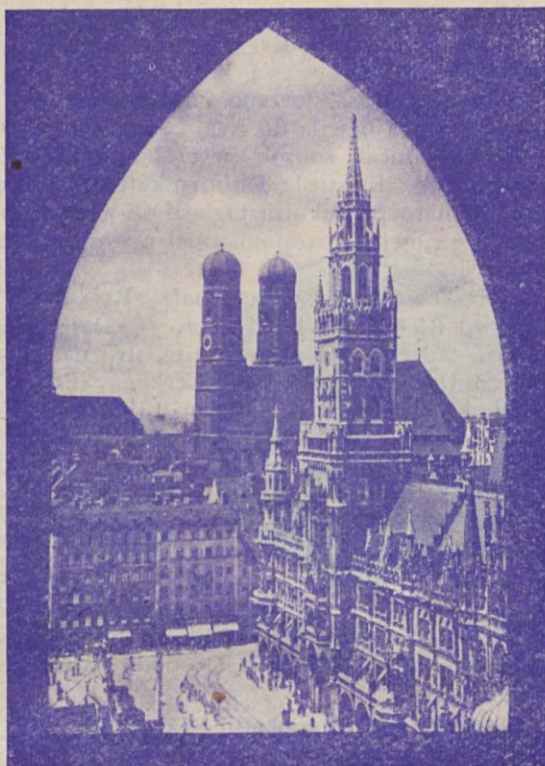
München. — Znamenita stavba mestne občinske hiše. V ozadju stolnica z dvema po 99 metrov visokima stolpoma.

Raziskovanja so ugotovila, da so ti zapiski nastali med leti 927 in 1025. Brižinski škofje so imeli