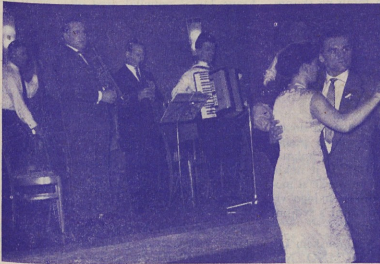
Na slovenski prireditvi 1. maja v Essenu.

strop-Schwerinu 27. maja. — Vsem parom kličemo: na mnoga srečna leta! Ne pozabite, da boste tolažbo v težkih urah, ki gotovo pridejo, končno našli le pri Bogu!