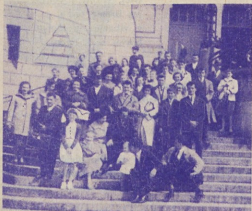
Slovenci pred baziliko v Lisieux v Franciji na velikonočni ponedeljek.