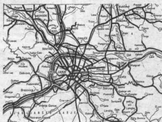
Cestna mreža Ljubljane s širšo okolico po stanju leta 1946 po osvoboditvi in leta 1986 ob 40-letnici našega dela

Po osvoboditvi leta 1945–46 smo imeli v Ljubljani urejenih le zelo malo mestnih cest in ulic. S kockami smo imeli tlakovano edino mestno vpadnico Celovško cesto proti Kranju širine 6,0 m/danice je široka 60,0 m. Vse druge vpadnice: Titova, Zaloška, Šmartinska, Litjska, Dolenjska, Izanska, da celo Tržaška cesta so bile vse v gramozu.