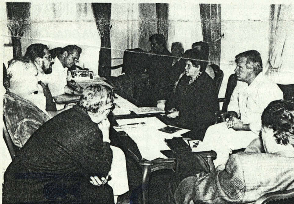
Upravni odbor Muzejskega društva Jesenice

Upravni odbor društva je na zadnji seji sklenil, da bo tudi letos članarina 1000 tolarjev. Trenutno je 230 članov, poslovanje društva pa je pozitivno. Društvo vlaga tudi veliko truda v lastne društvene prostore in zato že nekaj časa zbira sredstva za odkup stare Koronove hiše na Stari Savi.