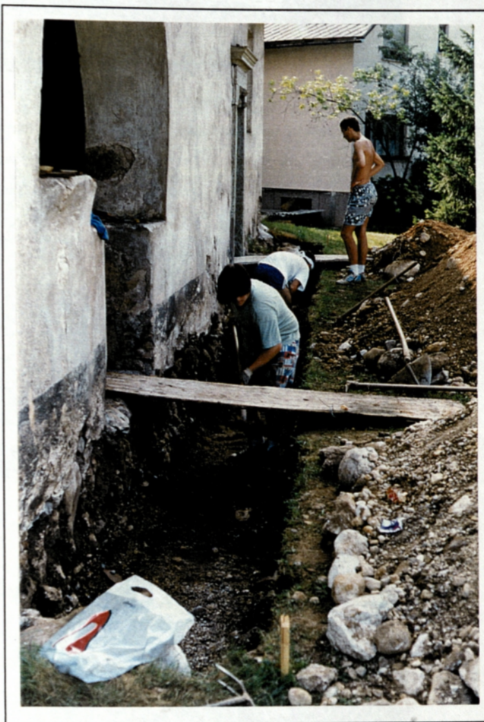
Izkopavanja pri cerkvi sv. Radegunde na Bregu (Foto Janez Meterc, avgust 1994)